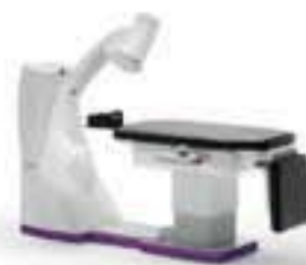
SkyView 3D CBCT panoramic imager