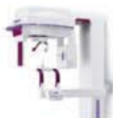
Hyperion Panoramic Imager