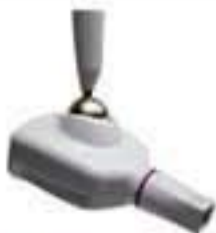
RXDC HyperSphere High frequency X-ray unit