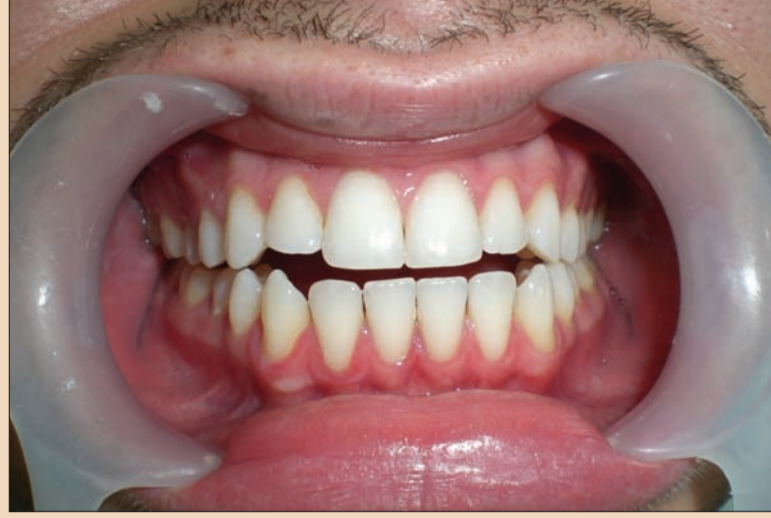
Resim 2. Sonrası.