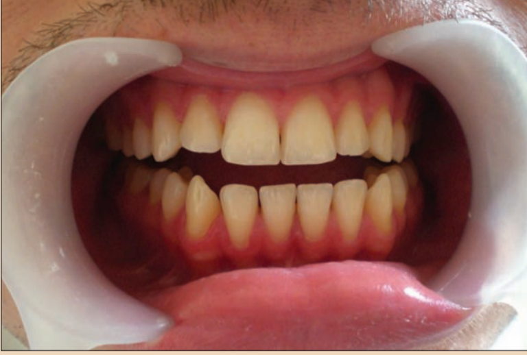
Resim 1. Öncesi.