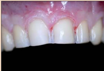
Рис. 7. Отпрепарированные зубы.