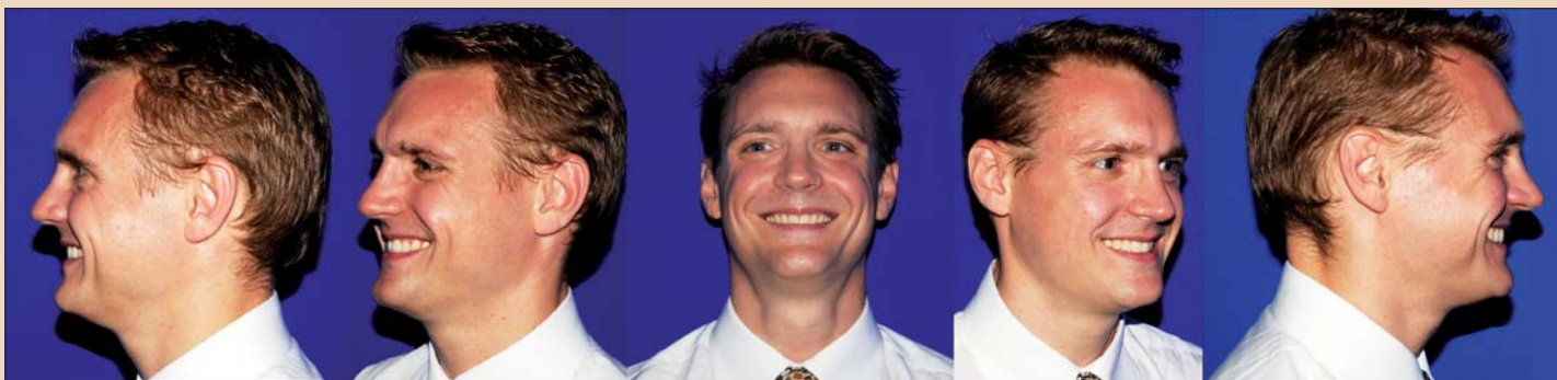
Рис. 14. Ситуация после вмешательства: снимки, сделанные под разными углами.

востью к абразии. В данном случае мы приняли решение использовать следующую комбинацию материалов: в качестве основы был использован материал Ao+Pressbody, на который послойно наносилась керамика Authentic. По завершении моделирования формы виниров они были запрессованы и покрыты глазурью. Четыре обжига позволили получить превосходный результат. Существенным преимуществом