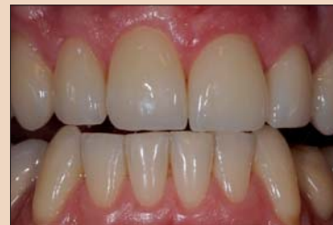
Рис. 12. Новое, гармонизированное режцовое ведение.