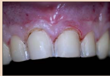
Рис. 5. Удлинение коронковой части зуба.