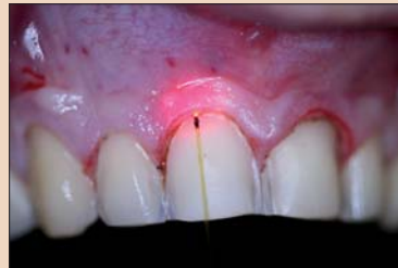
Рис. 8. Демонстрация десневой борозды при помощи диодного лазера.