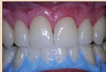
Рис. 11. Отбеливание.