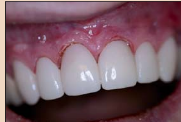
Рис. 9. Функциональные временные реставрации в соответствии с восковой моделью.