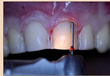
Рис. 6. Препарирование.