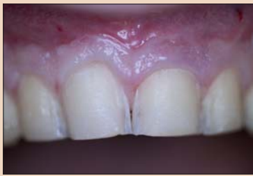
Рис. 4. Препарирование без коррекции десны.