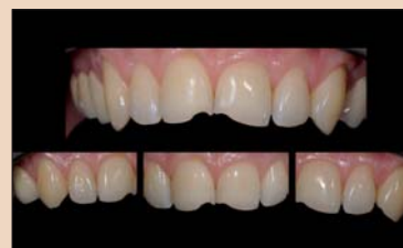
Рис. 1–3. Исходная ситуация, ярко выраженное нарушение окклюзии.