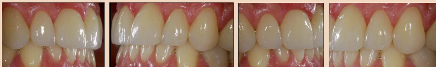
Рис. 13. а-г. Новое, гармонизированное режцовое ведение.