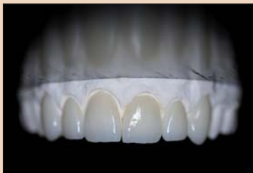
Рис. 10. Виниры на модели.