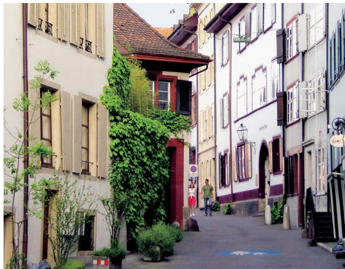
Altstadtgasse (Heuberg) am Spalenberg, der mit seinen unzähligen kleinen Gässchen und Boutiquen als Geheimtipp für Shopping gilt.