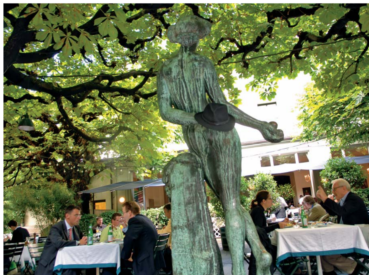
Das Restaurant Kunsthalle, seit Jahren ein beliebter Treffpunkt.