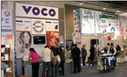
Los compuestos Amaris, material de restauración de alta estética, y Futura Bond, el primer adhesivo de autograbado y curado dual en dosis única, fueron dos de los productos de VOCO en esta feria.