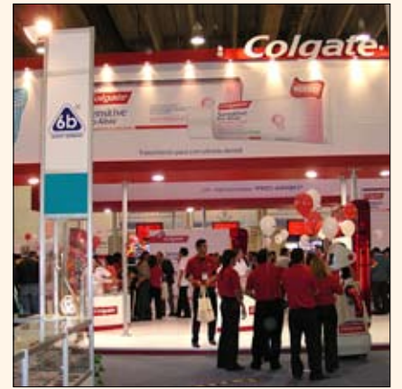
La pasta dental Colgate Sensitive Pro-Activ, con Pro-Argin, fue objeto de un número monográfico de investigación en el American Journal of Dentistry