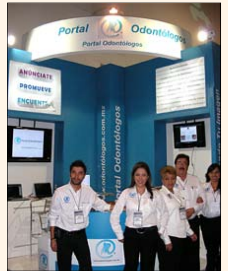
El equipo de Portal Odontólogos, la red online más eficiente de México, llega con sus mensajes a casi 20,000 dentistas.