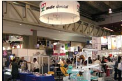
MDC Dental ha sacado al mercado su Max Print Machine, que dispensa cantidades exactas para preparar alginato y tomar impresiones dentales.