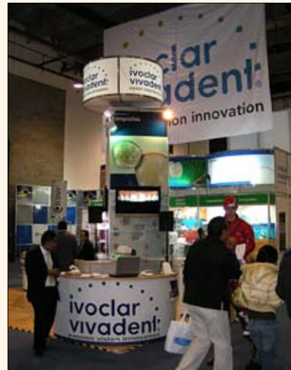
El polimerizador «bluphase» de Ivoclar Vivadent permite fotopolimerizar en múltiples indicaciones.