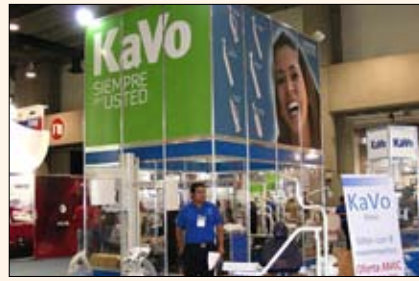
KaVo introdujo sillones con una amplia gama de movimientos a precios económicos.