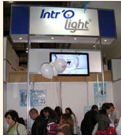
Las ingeniosas luces de la empresa mexicana Introlight son flexibles y se adaptan a una multitud de instrumentos quirúrgicos.