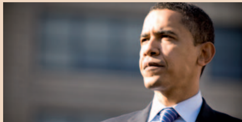
Barack Obama nie był ulubionym kandydatem amerykańskich dentyстів na prezydenta USA.

tystów biorących udział w sondażu 2 na 3 stwierdziło, że kandydat Republikanów John McCain byłby lepszym prezydentem dla dentyстів, 1 na 6 poparł Obamę, a pozos-