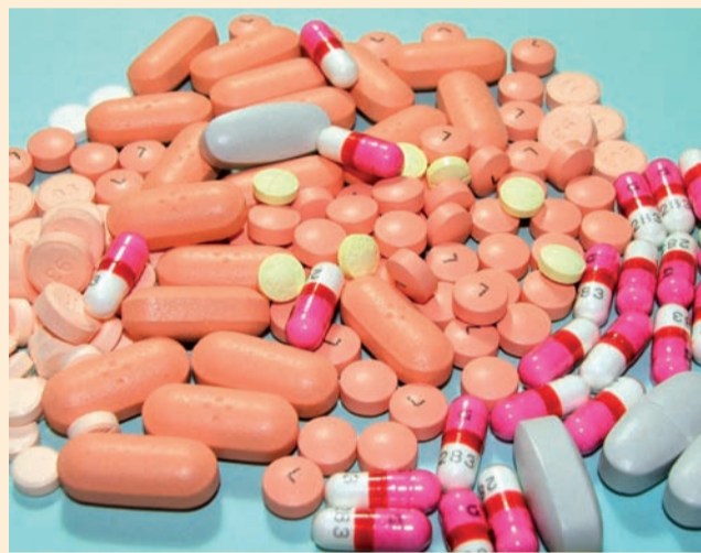
Les acheteurs de médicaments sur Internet ignorent qu'ils achètent des faux.

FRANCE : Le marché des faux médicaments représenterait près d'un milliard d'euros. C'est l'un des résultats d'une enquête Cracking Counterfeit Europe, initiée par le laboratoire Pfizer dans 14 pays européens. 77 millions d'Européens achèteraient leurs médicaments en dehors des circuits autorisés.