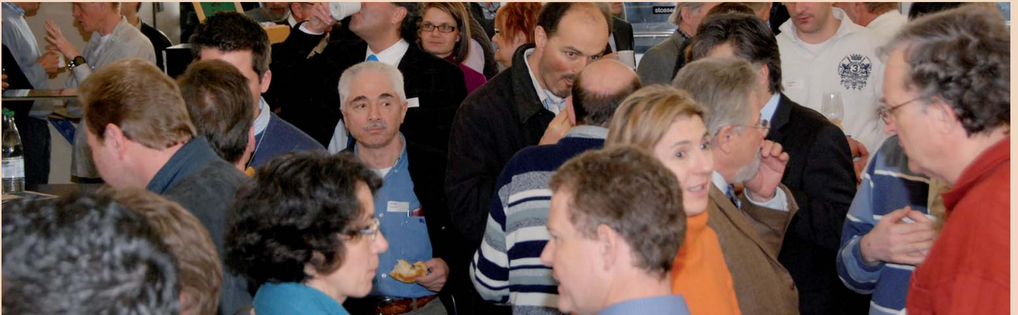
Dicht gedrängt wie das Programm, Kaffeepause im Foyer.

um Spannungen, welche auf eine Naht wirken, zu messen. Damit möglichst keine Dehizenzen entstehen, ist eine geringe Zugspannung wichtiger als die Dicke des Lappens.