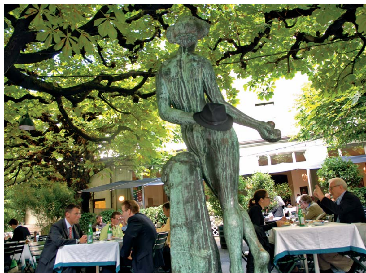
Das Restaurant Kunsthalle, seit Jahren ein beliebter Treffpunkt.

Die Zeit für eine klare Entscheidung drängt. Soll die Zahnmedizin weiter auf der Welle subjektiver Idealvorstellungen unserer Gesellschaft mitschwimmen und diese, in einem ethisch gefährlichen Spannungsfeld zwischen Heilkunde