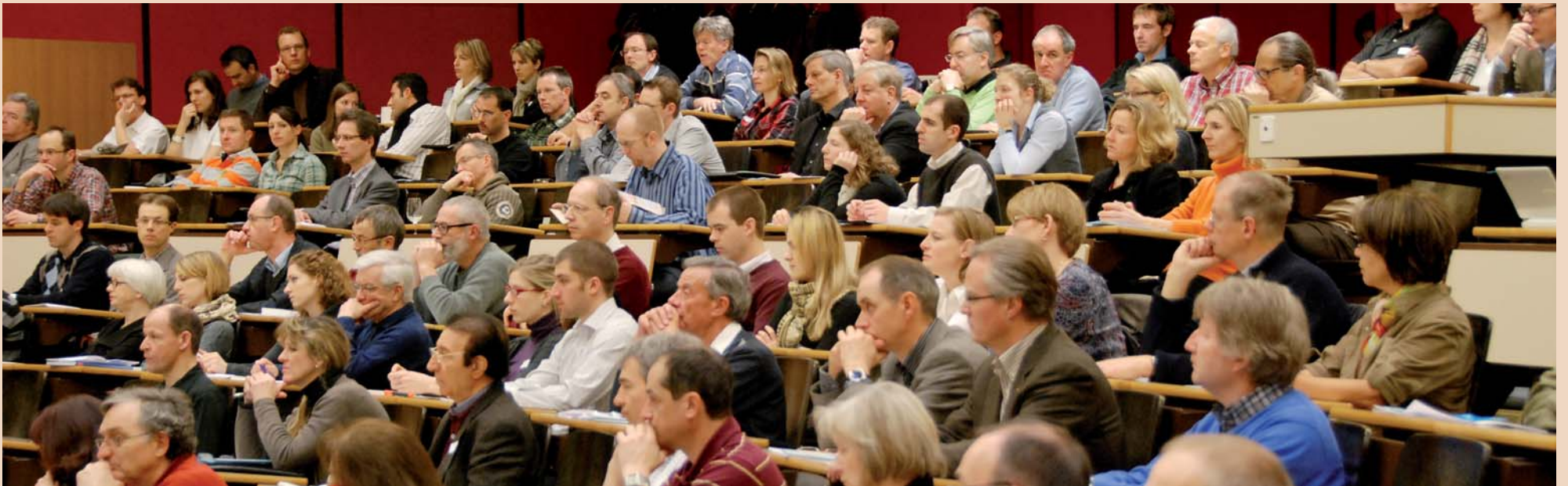
Sich fortbilden und Gutes tun. Über 240 Teilnehmer folgten im Auditorium Ettore Rossi (Kinderspital, Bern) den neun Vorträgen zu „Funktion & Illusion“.

oder einer Spülung mit Trane- xamsäure bekämpft werden. Bei der Osteoporose ist der T-Wert massgebend – je tiefer dieser ist,