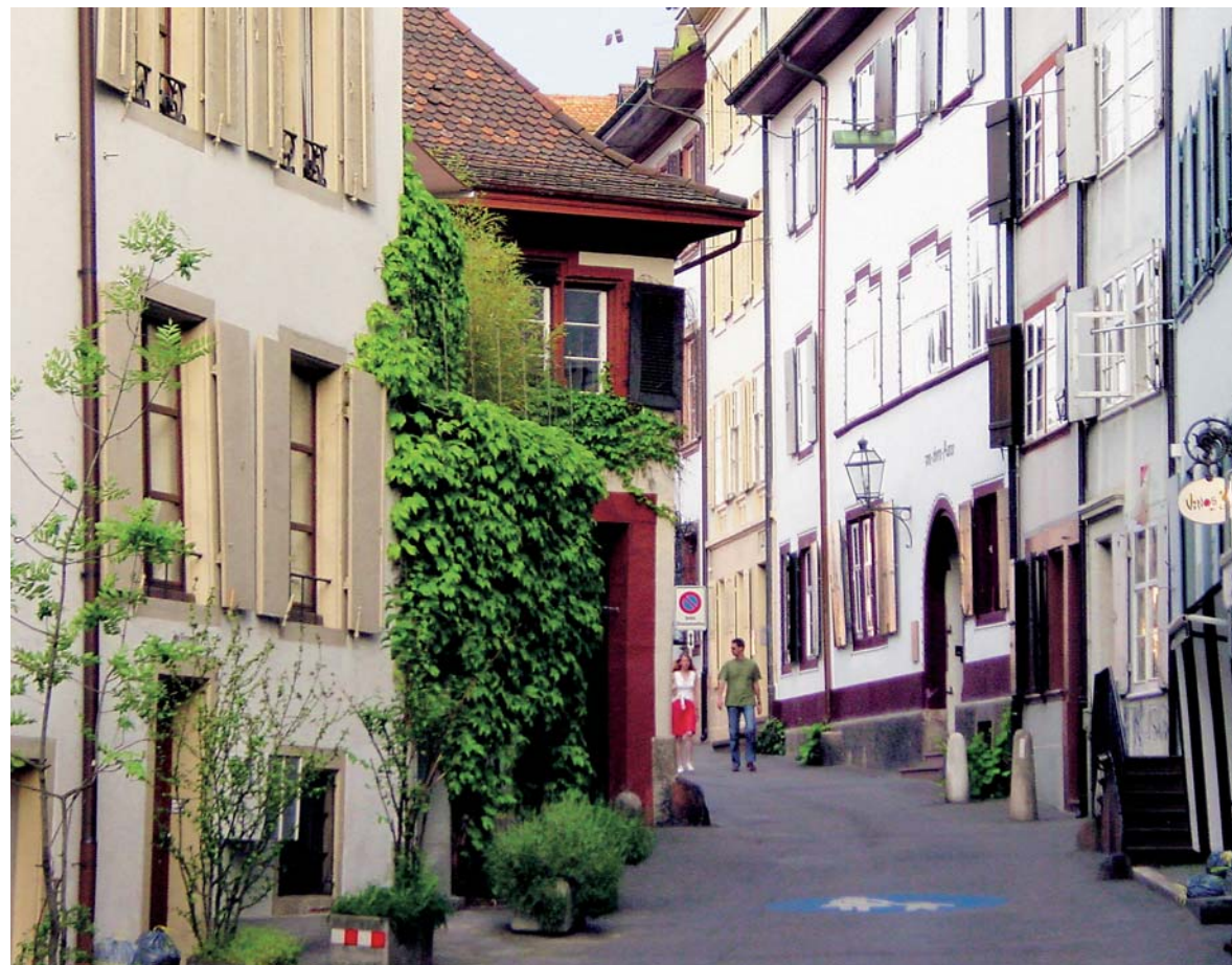
Altstadtgasse (Heuberg) am Spalenberg, der mit seinen unzähligen kleinen Gässchen und Boutiquen als Geheimtipp für Shopping gilt.