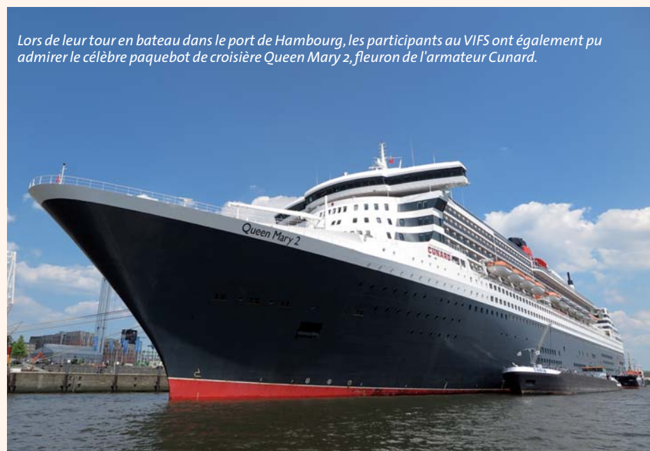
Lors de leur tour en bateau dans le port de Hambourg, les participants au VIFS ont également pu admirer le célèbre paquebot de croisière Queen Mary 2, fleuron de l'armateur Cunard.