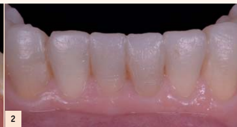
Fig. 2 : L'analyse radiologique nous montre une proximité photographie illustrant les masques ou mock-ups après plusieurs semaines de rééducation occlusale.