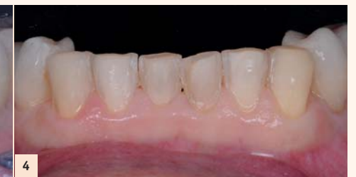
Fig. 4 : 33 à 43 préparées. Les secteurs postérieurs ont déjà été collés lors de la séance précédente. Les facettes seront collées quasiment à 100% dans l'émail. En effet, grâce à l'augmentation de DVO, les bords libres sont juste adoucis et les faces vestibulaires à peine préparées.