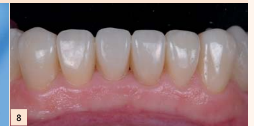
Fig. 8 : 6 facettes collées, chacune à sa place !