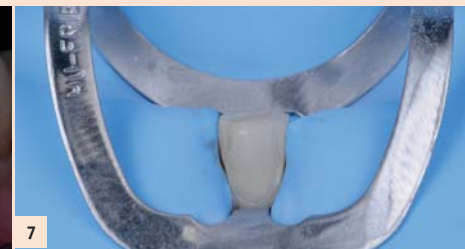
Fig. 7 : Le collage est individuel, en alternance, chaque facette étant réessayée, ajustée si nécessaire au niveau des points de contact. La boîte d'organisation permet de travailler en toute quiétude et d'être le lien entre l'assistante et le dentiste.