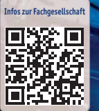
Am 26. und 27. September 2014 findet unter der Themenstellung „Mikroinvasiv – Minimalinvasiv: Integrative Lasertechnologie“ in Düsseldorf die internationale Jahrestagung der DGL statt.

angebotenen Dentallasern ist man in der Lage, alle etablierten Therapieeinsätze durchzuführen. Dass wir im Moment in Deutschland eine etwas