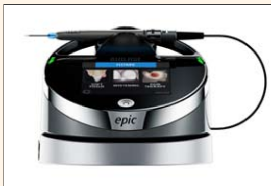
El láser de diodo portable Epic.

El Waterlase iPlus es un láser de Erbio de alta potencia que permite también tratar tejidos duros y viene en un distintivo color rojo Ferrari,