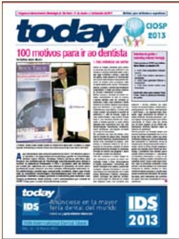
Portada del ejemplare de CIOSP Today, el periódico de ferias de Dental Tribune.

Oral-B, que instaló también stands de gigantescas dimensiones, utilizó CIOSP 2013 para lanzar su nueva revista, titulada Oral-B New América Latina , sobre la cual publicamos un artículo en esta edición. La empresa norteamericana Ultradent