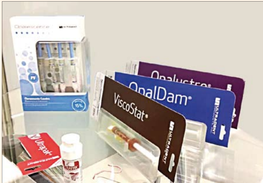
Varios de los productos que la empresa está fabricando actualmente en Brasil

ductos. Por el momento, estas nuevas líneas solo están a la venta en el mercado brasileño.