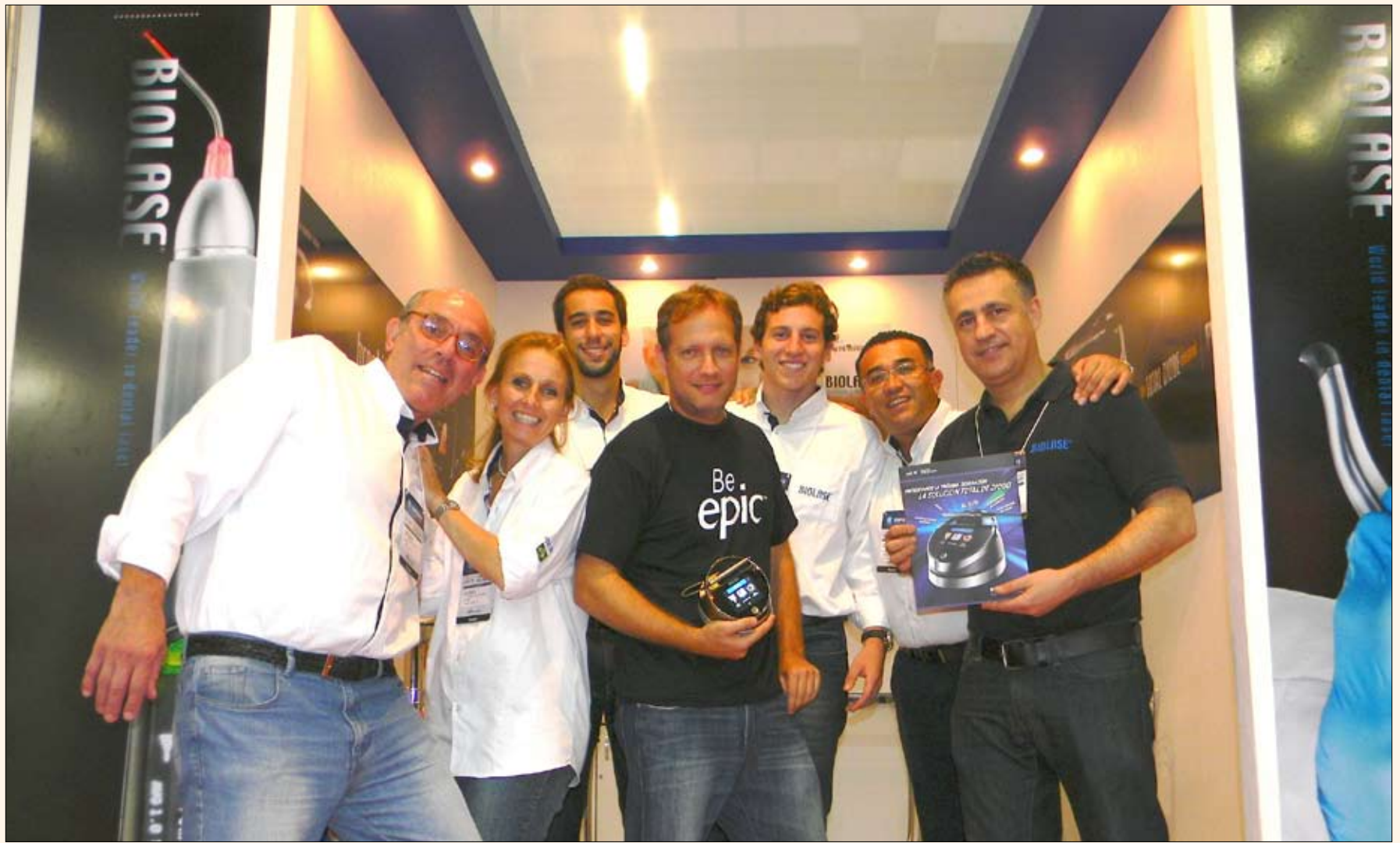
El equipo de Biolase en Brasil, donde presentaron el Epic, un nuevo láser de diodo que es efectivo, asequible y fácil de usar.