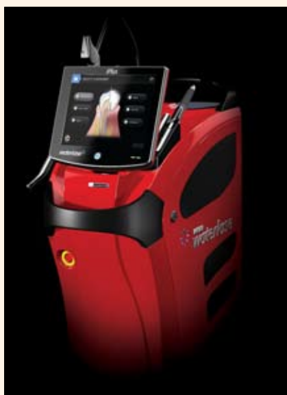
El Ferrari de los láseres dentales: el Waterlase iPlus.

por lo que el dispositivo es no sólo eficiente sino también atractivo.