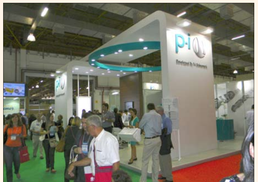
La compañía P-I, fundada por el Profesor Per-Ingvar Brånemark, manifestó que anunciará una importante noticia en la feria de IDS en Colonia.