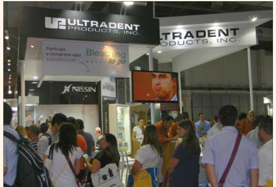
El stand de la empresa estuvo lleno durante toda la exposición, como se aprecia en la imagen.

línea de blanqueadores Opalescence, cuyo kit completo viene ahora en un nuevo estuche, al igual que en presentaciones de repuesto de cuatro jeringas.