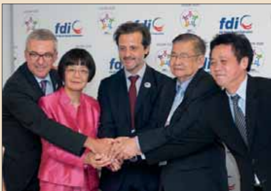
FDI与泰国牙科协会将共同举办2015年年会。