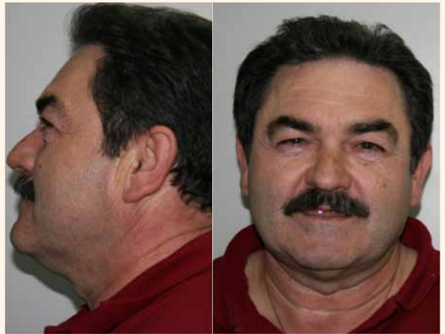
Figuras 1 y 2.

En relación a la prótesis sobre implantes, los sistemas de CAD/CAM aportan 16 :