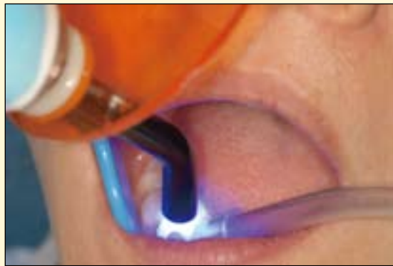
图5: 粘接剂20秒光固化。