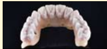
图11a: 牙本质瓷堆塑后首次烧结。