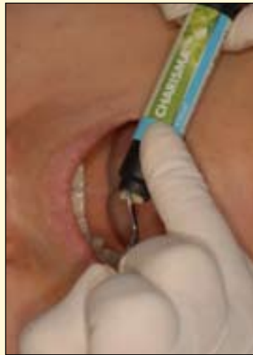
图7: 牙体色树脂充填。