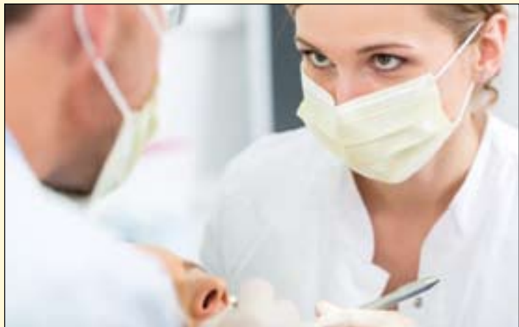
牙科治疗中可能发生异物的意外吸入和吞入。

中国西安: 在牙科治疗几乎所有的操作过程中, 都可能会发生牙科材料或器械等异物的意外吸入和吞入, 包括根管预备, 种植手术, 拔牙手术甚至口腔常规检查。一项对600多例事故报告和回顾的分析显示, 全冠和根管锉是最常见的吸入和吞入异物。