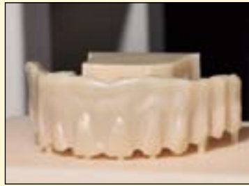
图1: 制作蜡型检查修复体适合性。