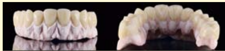
图12: 饰瓷后的牙龈结构。进行三维设计并运用多种色彩。

微结构)。我们建议进行细微的无序性的处理使最终效果更加生动。最终, 使用橡皮抛光器械进行抛光并上釉(不涂釉液)。使用手动抛光器械可以达到要求的光滑效果(图14, 15)。