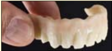
图9: 准备进行第一层瓷粉堆塑的支架。