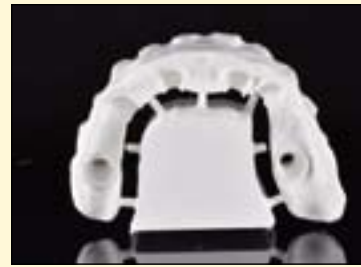
图2: 使用氧化锆制作支架 (Zenostar)。