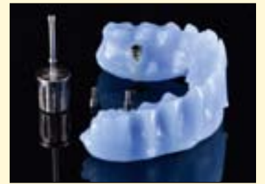
图3: 烧结支架。小突起在烧结过程中为支架提供了支撑。