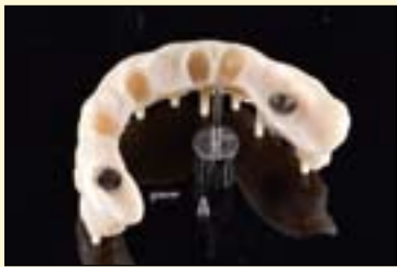
图4: 烧结后检查钛套筒的适合性。