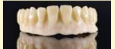
图11b: 牙本质瓷堆塑后首次烧结。