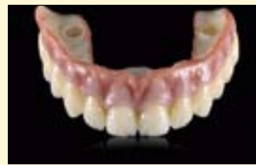
图14: 手工抛光后的最终修复体。