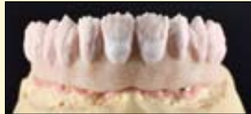
图10a: 按照指示进行瓷粉堆塑。