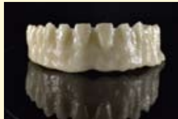
图6: 支架表面涂布IPS e.max Ceram ZirLiner, 烧结前。