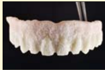
图7: 准备烧结前。牙龈及牙齿区域涂布相应材料。