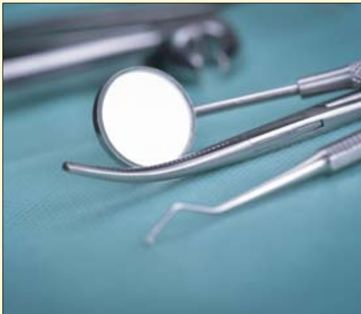
牙科设备市场预计在近几年将会发生大幅度的增长。

界牙科设备最大的市场份额, 因为其有利的医保制度, 政府对医疗保健越来越多的财政支出以及其人口老龄化速度的增长。然而, 亚太地区预计在最近几年将会达到最高的增长率, 因为其政策的宽松, 牙科治疗需求量的增加以及牙科旅游业的发展。