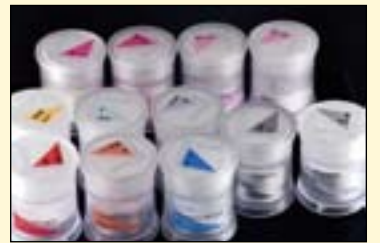
图8: 选择所需的牙本质材料 (IPS e.max Ceram)。