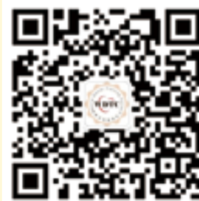
世界牙科论坛微信公众账号