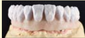
图10b: 按照指示进行瓷粉堆塑。