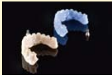
图5: 蜡型与烧结后的支架对比。