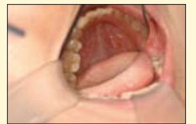
图2：去除原有充填物。

#45在去除原有充填物后可直接看见邻接面（图2），牙体制备后，窝洞会较原有范围扩大。为了更好地模拟牙齿本身的颜色，需要采用多层堆塑技术进行修复。去除旧充填物并尽可能保留牙体组织，备洞型，隔离工作区，控制污染，用气枪轻轻吹干牙面，对牙齿用35%的酸蚀剂进行酸蚀（图3）。牙釉质酸蚀20s，牙本质酸蚀15s，并彻底冲洗牙齿表面的酸蚀剂，避免残留和出现术后牙本质敏感的症状。气枪吹干粘接面后，用小毛刷在预备好的牙本质和牙釉质区域涂粘接剂并20秒光照固化，形成有效粘接层（图4、5）。窝洞表面呈现出光泽表面，之后可以使用Charisma Opal树脂充填。