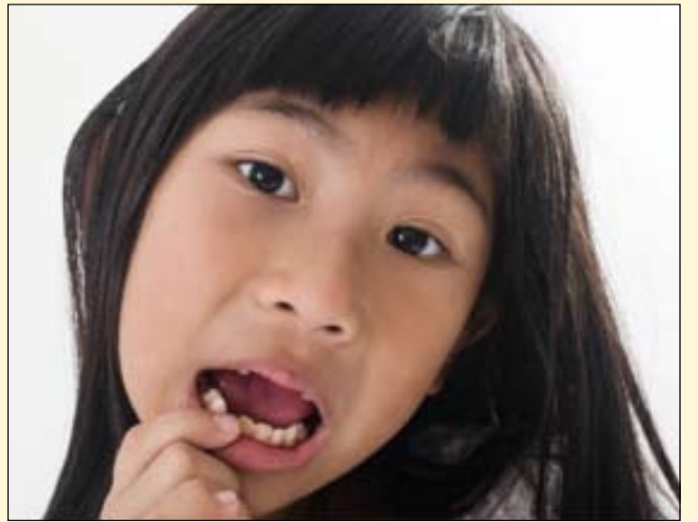
日本大阪府的一项调查发现大约有一半患有牙病的学生没有遵医嘱去看牙医。

日本大阪:在过去的三十几年里,虽然日本儿童的口腔健康状况得到极大改善,日本仍然在努力提高其儿童口腔健康意识并解决相关问题。一位大阪牙医协会代表说,在大阪府192所公立学校进行的调查发现只有一半在学校常规体检中被认为需要牙科治疗的学生随后去看了牙医。