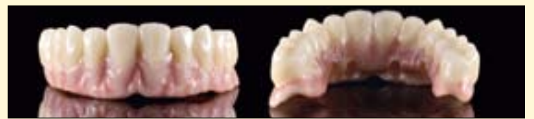
图13: 首次牙龈瓷烧结后。

的材料以及有关材料学的相关知识及材料特性至关重要。特别是面对较为复杂的氧化锆支架时, 正确的处理方法是成功的要义。在上述病例中, 支架(Zenostar T)以及饰瓷(IPS e.max Ceram)彼此适合, 因此可在颜色选择上自由发挥。由于使用了正确的烧结参数, 未出现分层细裂纹。DT