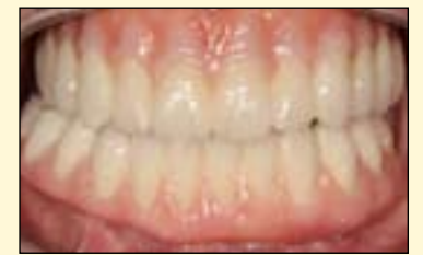
图15: 螺丝固位的修复体就位。