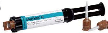
Multilink®N 通用型高强度树脂水门汀