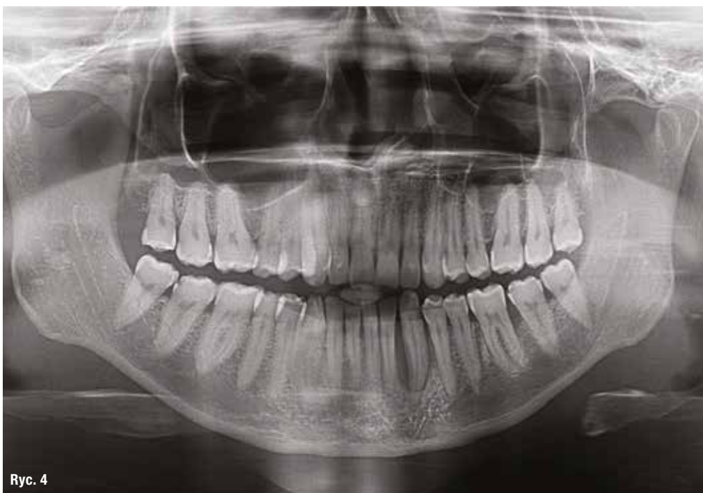
Ryc. 4 Zastosowanie Smart Dentin Grinder®. Zdjęcie pantomograficzne przed leczeniem. Ząb 33 zakwalifikowany do ekstrakcji.

Andersson i wsp. opisali metodę leczenia całkowicie zwichniętych w wyniku urazu zębów za pomocą replantacji. 3 Replantacja jest zabiegiem polegającym na ponownym wprowadzeniu do zębodołu zwichniętego zęba i w wielu sytuacjach klinicznych jest skuteczna. Należy zaznaczyć, że przy replantacji istotny jest stopień dojrzałości korzenia (otwarty lub zamknięty wierzchołek) oraz stan więzadeł ozębnej. W opisywanej metodzie oczyszczone, lecz niesterylne, całkowicie zwichnięte zęby są wprowadzane do odświeżonego zębodołu i stabilizowane za pomocą szyny elastycznej. Replantowane zęby, zgodnie z wytycznymi IADT, należy kontrolować klinicznie i radiologicznie początkowo po 4 tygodniach, 3 miesiącach, 6 miesiącach, po roku, a następnie każdego roku do zakończenia rozwoju. 3 Za sukces leczenia przyjmuje się bezobjawowy żywy ząb wykazujący fizjologiczną ruchomość oraz radiologicznie widoczny prawidłowy przebieg ozębnej i zamknięcie wierzchołka.