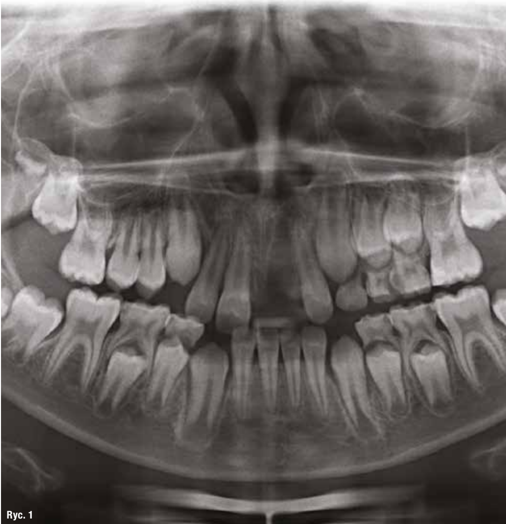
Ryc. 1 _Autotransplantacja. Obraz radiologiczny przed leczeniem. Zaplanowana autotransplantacja zęba 34 w miejsce utraconego w wyniku urazu zęba 11.