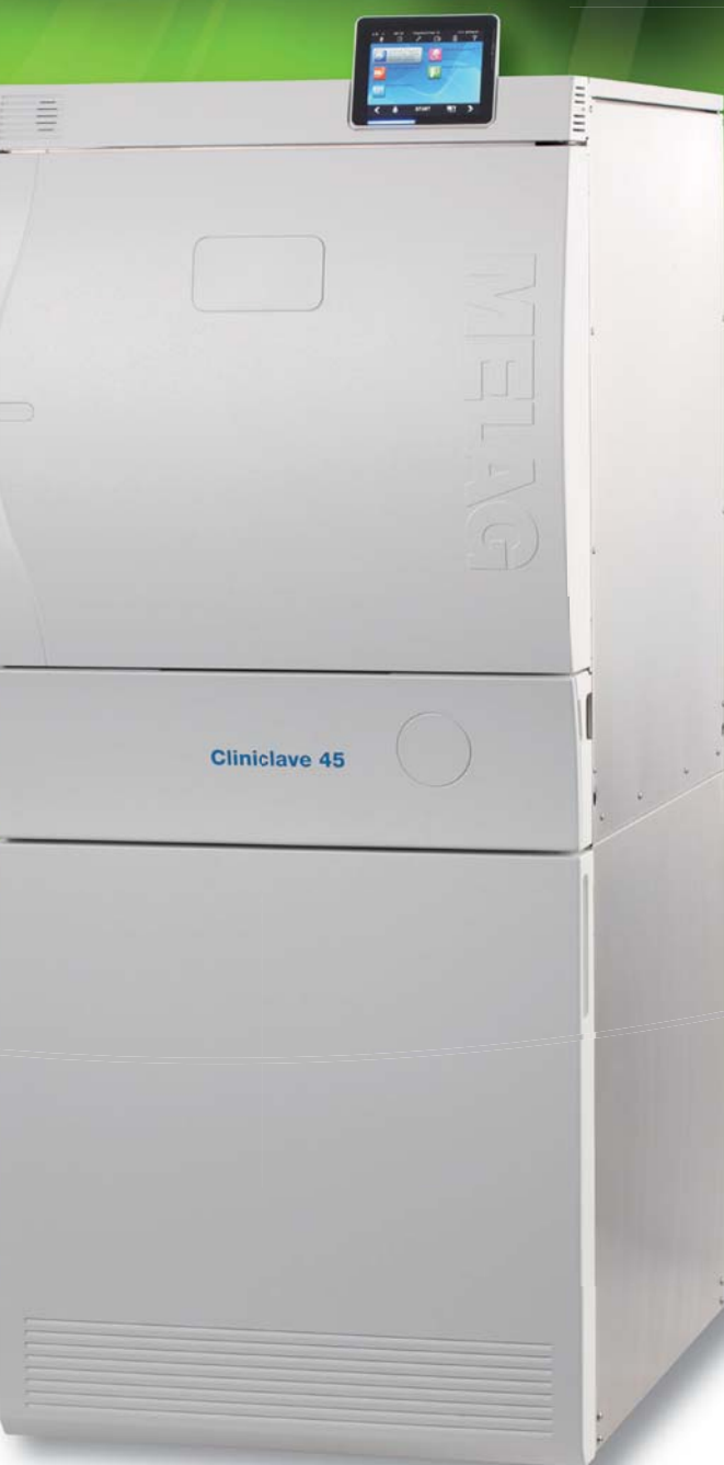
Stérilisation Vacuklav® 44B+ & Cliniclave® C45