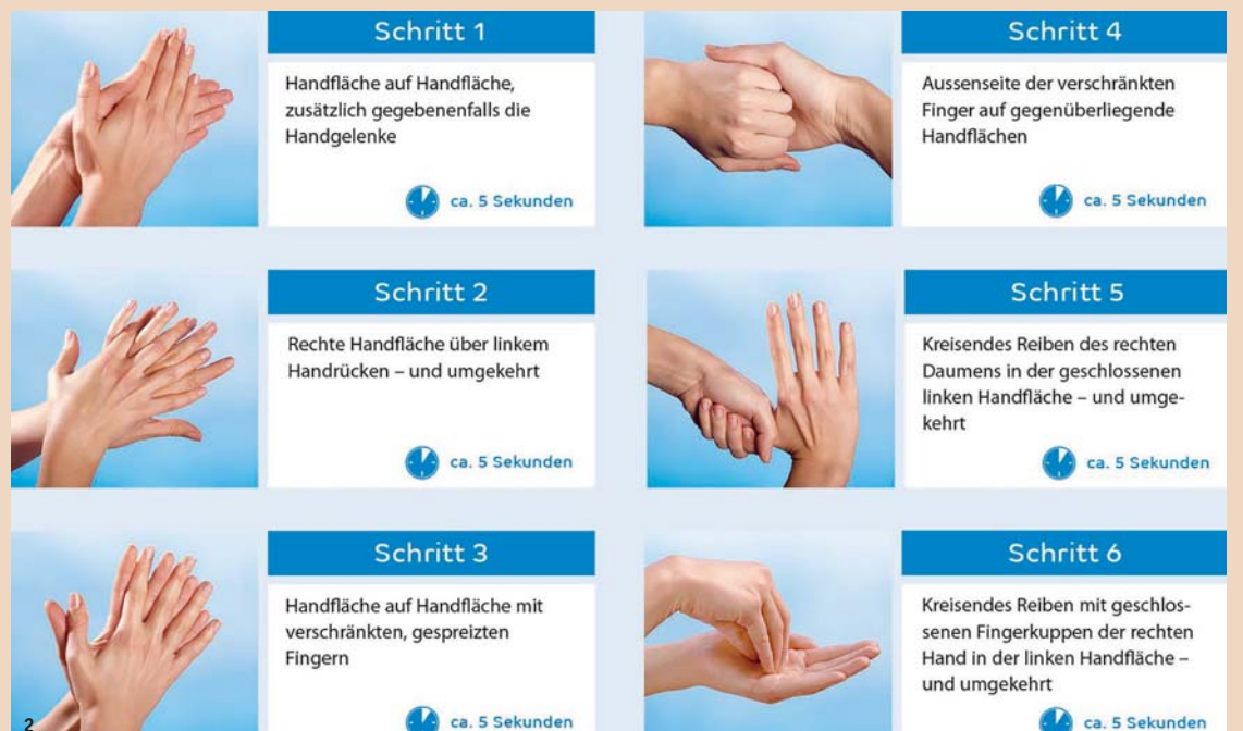
Abb. 2: Sechs Schritte der Händedesinfektion.

Maximale Infektionsprävention hat allerhöchsten Stellenwert, um sowohl Patienten als auch Personal zu schützen. Untersuchungen zeigen, dass Mikroorganismen, wie Staphylococcus aureus (und dessen resistente Variante MRSA), ohne ausreichende Dekontaminationsmassnahmen bis zu mehreren Monaten auf unbelebten Flächen noch nachgewiesen werden konnten. Influenzaviren werden durch Tröpfchen- und Schmierinfektion übertragen. Bakterien und Viren können zum Beispiel über mehrere Tage an Oberflächen und Türgriffen, Treppengeländern oder Ge-