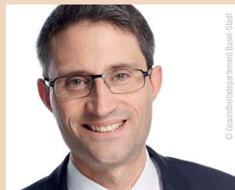
Regierungsrat Lukas Engelberger

Der 41-jährige Regierungsrat wurde per 1. April 2017 für den Rest der laufenden Amtsperiode 2014 bis 2017 gewählt. Die Kantone haben für die Ernennung von maximal drei Mitgliedern des Gremiums ein Antragsrecht.