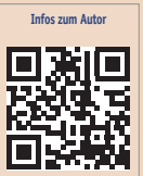
Infos zum Autor

Schülke & Mayr AG Sihlfeldstrasse 58 8003 Zürich Schweiz www.schuelke.ch