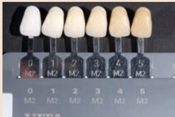
Sl. 10 Linearguide korišten za odabir svjetloće boje