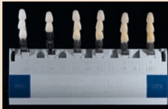
Sl. 8 3D-Master posložen samo s M nijansama vrijednosti od 0 do 5

Nakon raspoređivanja ključa boja prema svjetloći boja, zube i ključ boja lagano smočite s prozirnom glazirajućom tekućinom. Najbolji način za odabir nije odabrati ono prvo što nam se učini kao da je oda-