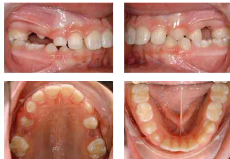
Figuur 15.2 Klinische foto's voor aanvang van de behandeling. Occlusie rechts (A), occlusie links (B), occlusaal aanzicht bovenkaak (C) en occlusaal aanzicht onderkaak (D).

Agenesieën in de laterale delen zullen vroeg of laat leiden tot functionele problemen. Wanneer wordt gekozen voor behoud van de melkmolaren, zal dit leiden tot gebrek aan functie. Melkmolaren hebben een kortere kroon dan blijvende elementen, waardoor ze in infraocclusie komen te staan.