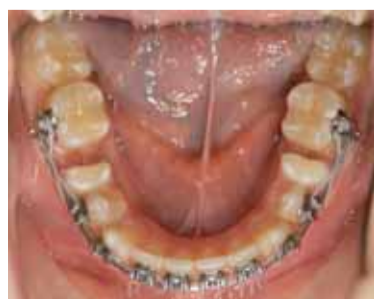
Figuur 15.5 Klinische foto's na extractie van de distale radix. Occlusie rechts (A), occlusie links (B), occlusaal aanzicht bovenkaak (C), occlusaal aanzicht onderkaak (D). De diastemen zijn al gedeeltelijk gesloten.