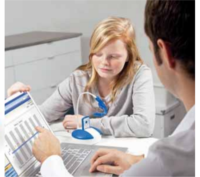
Smokkelen met beugeldragen is verleden tijd met de chip van TheraMon.

AMSTERDAM - Speciaal voor pubers die hun beugel niet lang genoeg dragen, is een beugel met ingebouwde chip ontworpen. Door de chip via een apparaat uit te lezen, kan de orthodontist precies zien hoe vaak en hoe lang de beugel per dag in de mond is geweest. De beugelchip werkt op lichaamstemperatuur en is volgens de producent niet fraudegevoelig, bijvoorbeeld door het onder een warmtelamp te leggen. Verzekeraars zijn enthousiast en hebben besloten de chip te vergoeden.