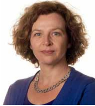
Minister Edith Schippers van VWS.

Het voorstel van de Minister van VWS volgt na ophef over een Nederlandse vaatchirurg die in een Schots ziekenhuis werkte, terwijl hij in Nederland bij twee ziekenhuizen was weggestuurd. Eerder kwam de aan medicijnen verslaafde neuroloog Ernst Jan-