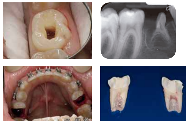
Figuur 15.3A Endodontische opening na pulpotomie van element 75. B Periapicale opname direct na extractie distale radix van element 85. C Klinische (spiegel)opname na extractie van distale radices van de elementen 75 en 85 en occlusale afwerking. D Geëxtraheerde distale radices van de elementen 75 en 85, de pulpakamer gevuld met glasionomeercement (Fuji ix).

* Deze figuur betreft een andere casus doch geeft een goed beeld van het effect van de hemisectie. Van Wiep zijn helaas direct na de extractie geen periapicale opnamen gemaakt.