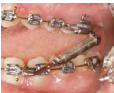
Figuur 15.4 Direct Push Rod (DPR), waarmee de onderkaak naar voren gedragen wordt, om de klasse II te corrigeren.