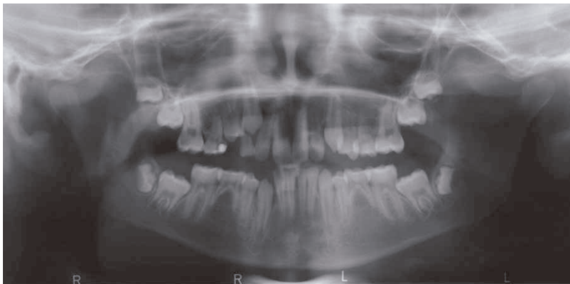
Figuur 15.1 Orthopantomogram: agenesie van de elementen 35 en 45.

Bij patiënten met persisterende melkelementen en bij patiënten met infraocclusie van de tweede melkmolaren is het ook essentieel om een orthopantomogram (OPG) te maken. De kans bestaat dat de opvolger agenetisch is.