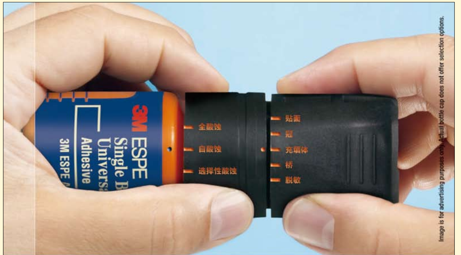
Image is for advertising purposes only. Actual bottle cap does not offer selection options.

我本人从事氧化锆材料制作已有19年, 对氧化锆的理解可能与别人不同, 因此我们能寻找到最适合齿科应