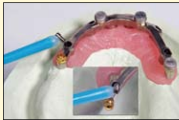
图1, 示范的是粘接棒粘取了一个微型种植体螺丝, 并把它拧入到锁扣锁定。而且, 为了使粘接棒能够容易的进入到嘴内区域, 这些可以往任何方向弯曲的粘接棒或许对于医生来说是个挑

战。我相信我们中有些人在使用微型螺丝来锁定种植体桥支架和/或锁扣时都会有弄掉了一个或多个微型螺丝的不愉快的经历。通过使用粘接棒, 我已经大大减少了滑移的数量。