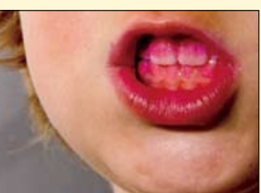
今后，氧化石墨烯或可用于治疗由致病菌引起的口腔疾病。