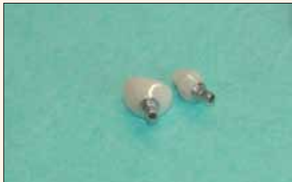
Fig. 11. Estándar contemporáneo: pilares cerámicos personalizados para evitar cementitis, con un «alma» de titanio para un atornillado seguro.