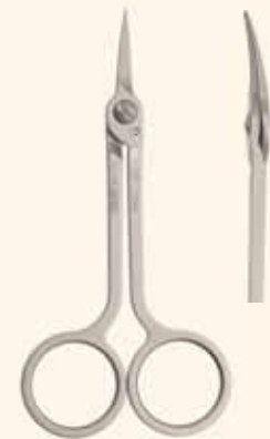
Cod. 3586 (mm 115) Curvo