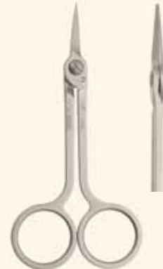
Cod. 3585 (mm 115) Recto

Tijeras Quirúrgicas HI-TECH: cortadas con laser y fabricadas con un tipo de acero especial que permite obtener un nivel de afilado superior y una dureza de 56 HRC.