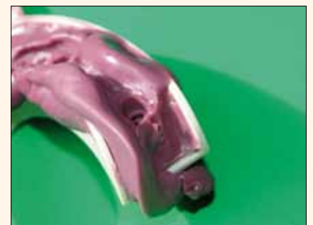
Fig. 5. Otra característica específica: ¿qué hacer en caso de que la bandeja sea «demasiado larga» por vestibular y resulta imposible tomar una impresión correcta?