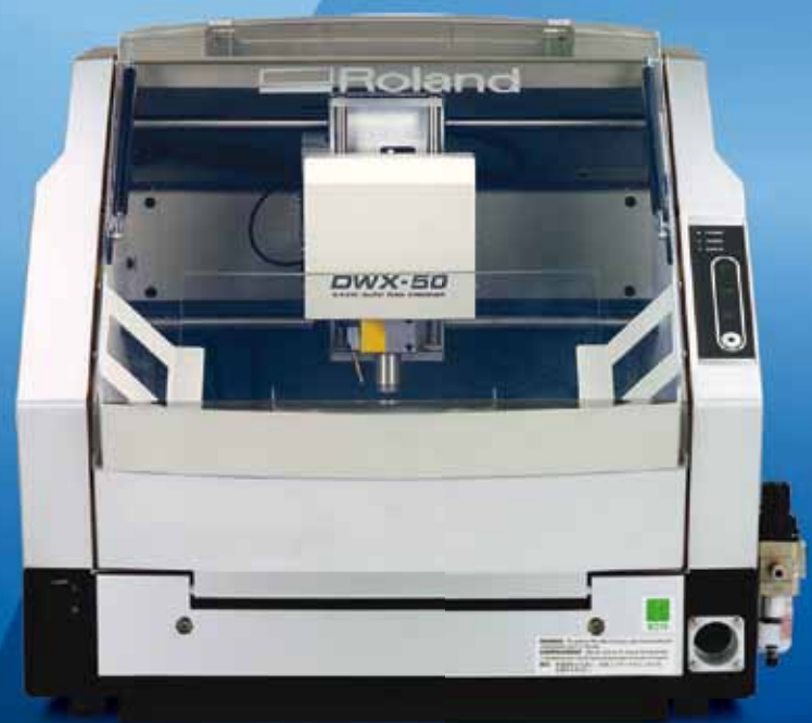
Fresadora Dental de 5 Ejes DWX-50