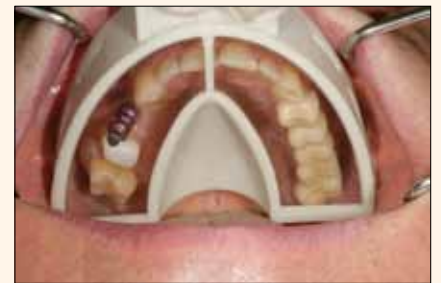
Fig. 3. Manejo fácil y limpio. No se mancha cuando se toma la impresión.

¿Ha tenido problemas de falta de espacio debido a la posición vestibular (o