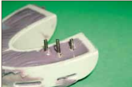
Fig. 9. Retire los tornillos una vez, fotocurada la impresión. Atornillelos otra vez después de retirar de la boca la impresión con los postes incrustados.