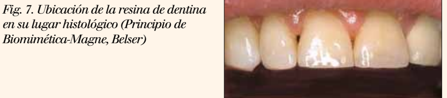
Figs 8 y 9. Colocación de Trans White de Amelogen Plus (Ultradent). Efecto muy estético pero diferente del caso anterior; también con la difusión adecuada.