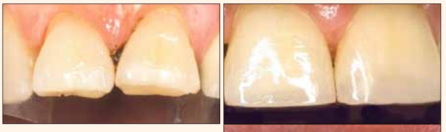
Fig. 7. Ubicación de la resina de dentina en su lugar histológico (Principio de Biomimética-Magne, Belser)