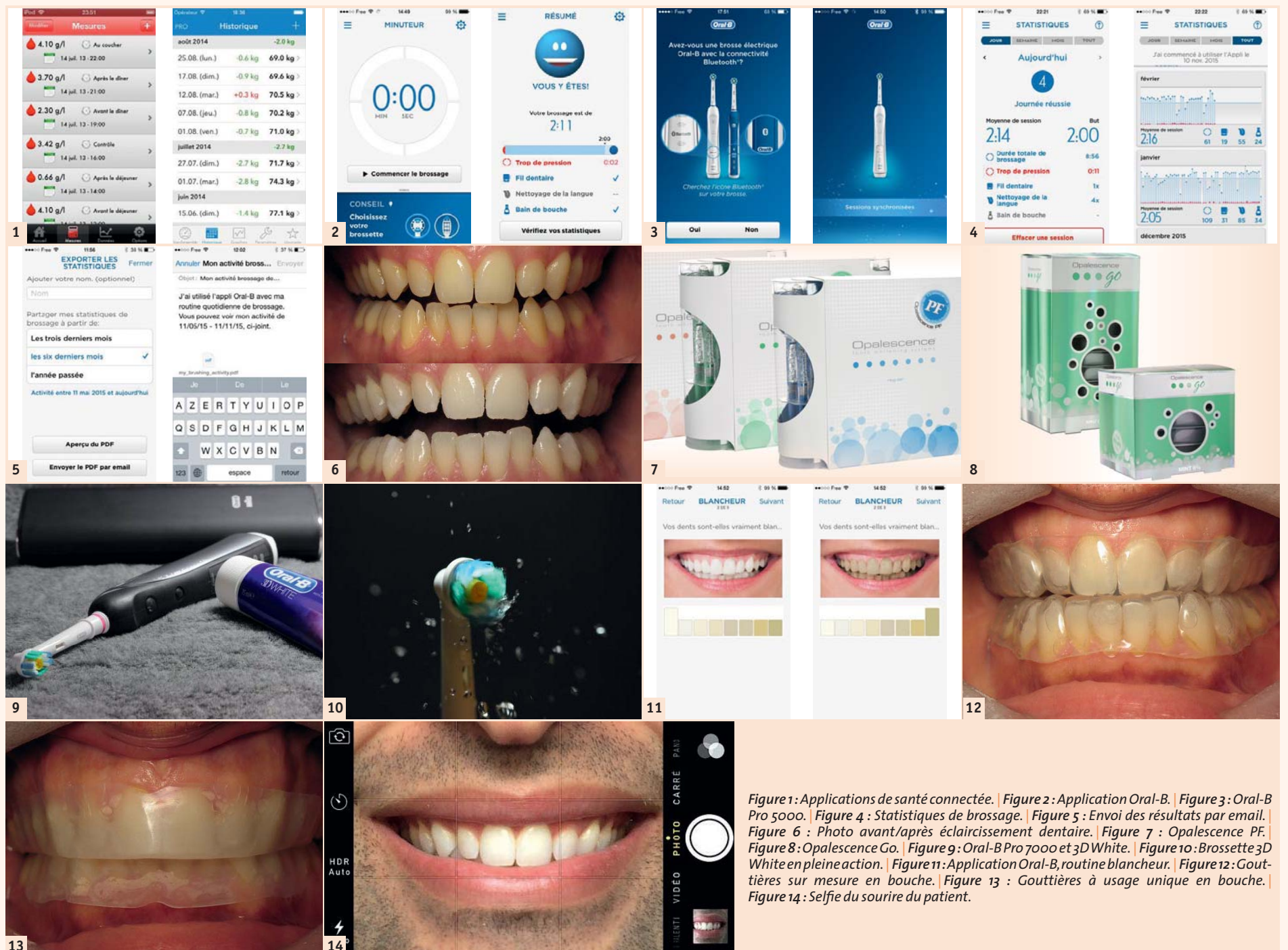
Figure 1: Applications de santé connectée. | Figure 2: Application Oral-B. | Figure 3: Oral-B Pro 5000. | Figure 4: Statistiques de brossage. | Figure 5: Envoi des résultats par email. | Figure 6: Photo avant/après éclaircissement dentaire. | Figure 7: Opalescence PF. | Figure 8: Opalescence Go. | Figure 9: Oral-B Pro 7000 et 3D White. | Figure 10: Brossette 3D White en pleine action. | Figure 11: Application Oral-B, routine blancheur. | Figure 12: Gouttières sur mesure en bouche. | Figure 13: Gouttières à usage unique en bouche. | Figure 14: Selfie du sourire du patient.

L'application de santé dentaire connectée va le guider dans son brossage mais également dans l'évolution de la teinte dentaire. Habituellement, seul le dentiste effectuait la mesure de la teinte en pré-opératoire et en post-opératoire. Désormais, le patient va pouvoir suivre attentivement cette amélioration grâce à l'application.