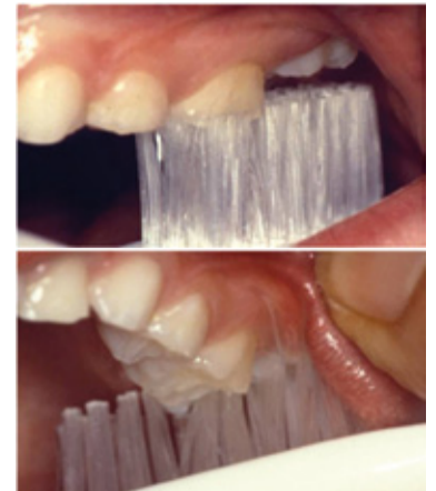
Tijdens de doorbraak wordt het element overgeslagen als de tandenborstel in de lengterichting op de tandboog wordt geplaatst. Als je de borstel dwars op de tandboog zet, is adequate reiniging mogelijk.