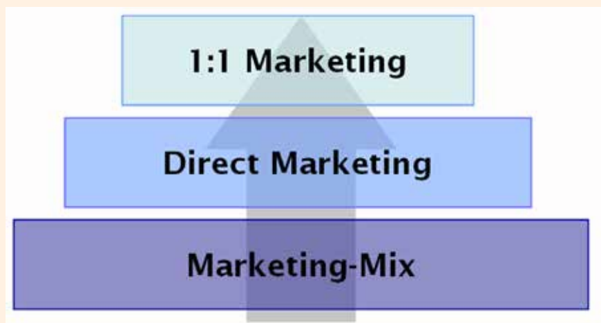
El reto ante el tsunami mediático: lograr una comunicación directa, cara a cara (one-to-one).

* Fundador y Director de Swiss Dental Marketing: swissdentalmarketing.com.