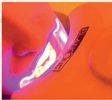
Fotoattivazione del gel sbiancante (fluorescenza osservata attraverso un filtro).

il bianco del proprio sorriso. Un po' come il tagliando programmato dalla nostra auto, il paziente viene accompagnato attraverso un percorso volto a mantenere il suo sorriso sempre bianco e luminoso nel tempo.