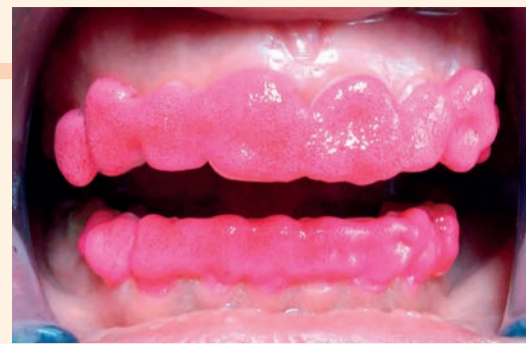
Sviluppo di ossigeno nel gel sbiancante foto attivato (BlancOne® CLICK dopo 10 minuti).