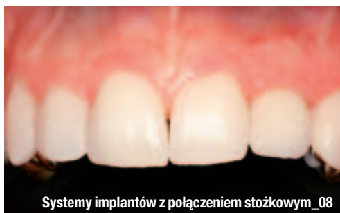
Systemy implantów z połączeniem stożkowym_08