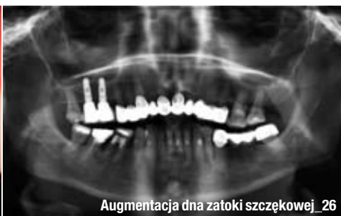
Augmentacja dna zatoki szczękowej_26