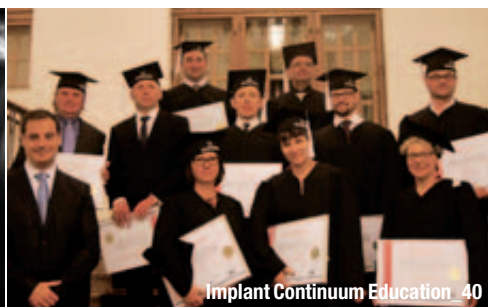
Implant Continuum Education_40