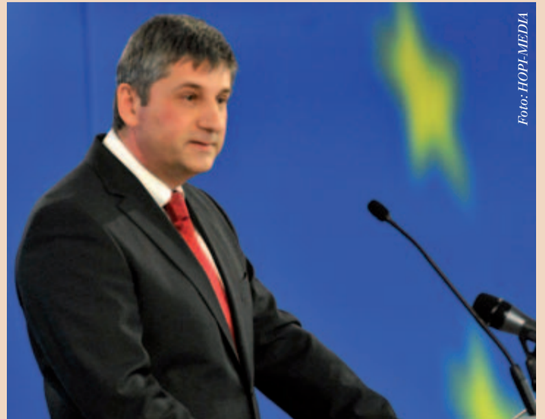
Außenminister Michael Spindelegger bei seiner Grundsatzrede zur Österreichischen Außenpolitik.

Für seine Pläne hat Spindelegger Rückendeckung von Salzburgs Landeshauptfrau Gabi Burgstaller erhalten. Auch sie will laut Presse den Ansturm deutscher Studenten/-innen verhindern. Einen weit aus drastischeren Vorschlag machte Josef Bucher von der BZÖ, der sich auch in die Debatte mit einmischte. Der Parteichef und Abgeordneter des Nationalrates forderte eine Ein-