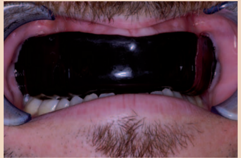
Zahnschutz in Situ mit Impressionen für den Unterkiefer.