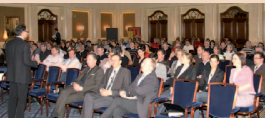
150 interessierte Teilnehmerinnen und Teilnehmer verfolgten morgens die Vorträge.