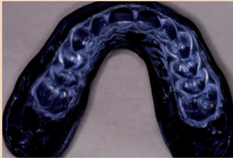
Fassung bis 18/28. Maximale Dämpfung von Schlägen gegen Unterkiefer, sofern diese Ausdehnung vom Spieler toleriert wird.

Dr. Scheidegger: Sind Zahnfragmente oder avulsierte Zähne vorhanden, werden diese leget artis gelagert (SOS Zahnrettungsbox von Hager & Werken). Avulsierte Zähne werden wenn möglich an Ort reponiert und provisorisch geschient bzw. der Spieler transportfähig gemacht.