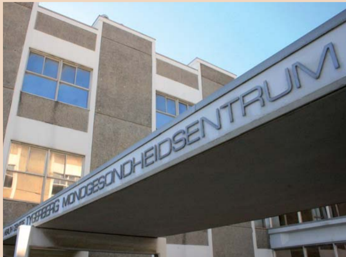
Wydział Stomatologii UWC oferuje wiele programów kształcenia podyplomowego.