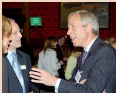
Earl Howe (po prawej), DTI; fot. dzięki uprzejmości The Prostate Cancer Charity.

Jako nowy podsekretarz stanu Howe będzie również odpowiedzialny za publiczną służbę zdrowia (National Health Service, NHS), reformy NHS, podstawową opiekę zdrowotną, leki, farmację i przemysł, NICE, badania i rozwój, innowacje i finanse oraz quasi-re-sortowe instytucje publiczne (Arm's Length Bodies).