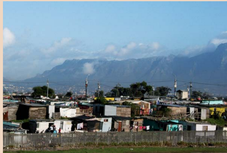
Khayelitsha – okręg podmiejski niedaleko Cape Town.

Republika Południowej Afryki to pierwszy kraj afrykański, w którym zorganizowano Mistrzostwa