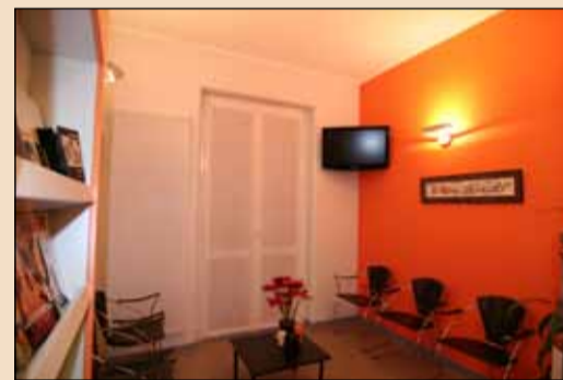
La sala d'attesa.