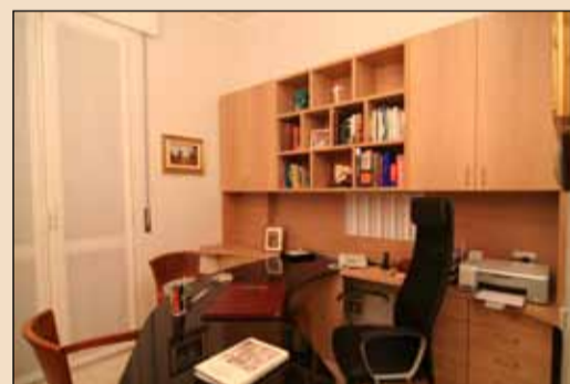
Lo studio privato.