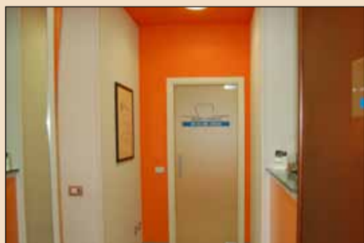
L'entrata dello studio.