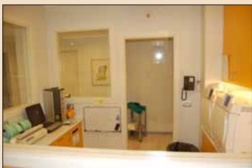
La sala di sterilizzazione.