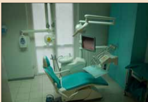
Una delle unità operative.