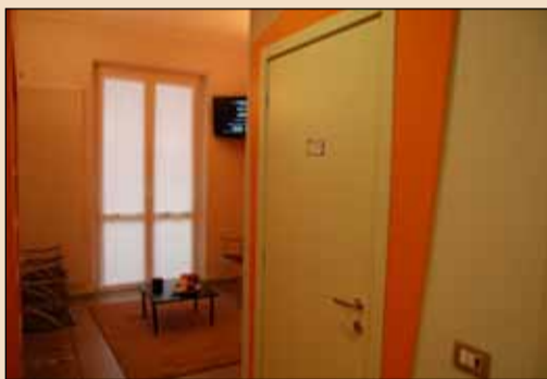
La sala d'attesa.