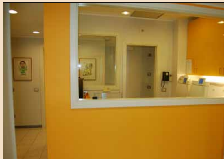
La sala di sterilizzazione.

A questo punto, chiedo al professore quale sia il "segreto" per ottenere ambienti così funzionali, dove niente è lasciato al caso: è sufficiente affidarsi a una società che si occupa di ristrutturazioni? La risposta è immediata. "È certamente fondamentale affidarsi a società specializzate e competenti, senza dimenticare però che è ne-