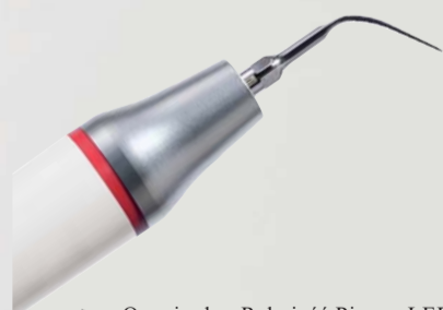
> Oryginalna Rękojeść Piezon LED ze Szwajcarską Końcówką PS

Coś więcej o profilaktyce > www.ems-swissquality.com