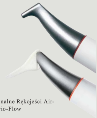
> Oryginalne Rękojeści Air-Flow i Perio-Flow

Usuwanie szkodliwego biofilmu aż do samego dna kieszonek. To istota Oryginalnej Metody Air-Flow Perio. Poddźiąsłowa redukcja bakterii zapobiega utracie zęba (periodontitis) lub utracie implantu (periimplantitis). Regularne zawirowania strumienia mieszanki powietrza i piasku oraz woda zapobiegają odmie – nawet gdy docierają do granic profilaktyki – dzięki działaniu końcówki Perio-Flow.