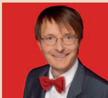
Karl Lauterbach

BERLIN – Bundesgesundheitsminister Philipp Rösler (FDP) verteidigt die geplanten Reformen des Gesundheitssystems. Unterdessen wirft ihm Karl Lauterbach (SPD) vor, „den Weg in die Zweiklassenmedizin zu gehen“.