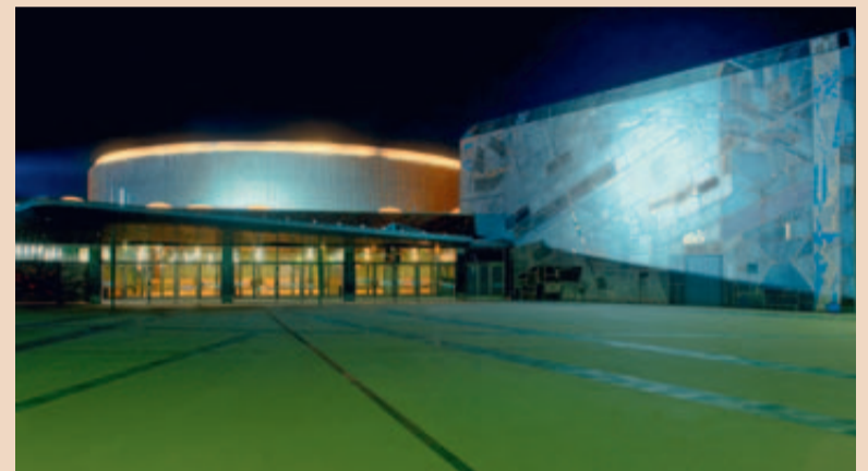
Die Liederhalle in Stuttgart ist Treffpunkt für die internationale Tagung von CAMLOG.

Für diejenigen, die sich nicht nur für dentale Implantologie,