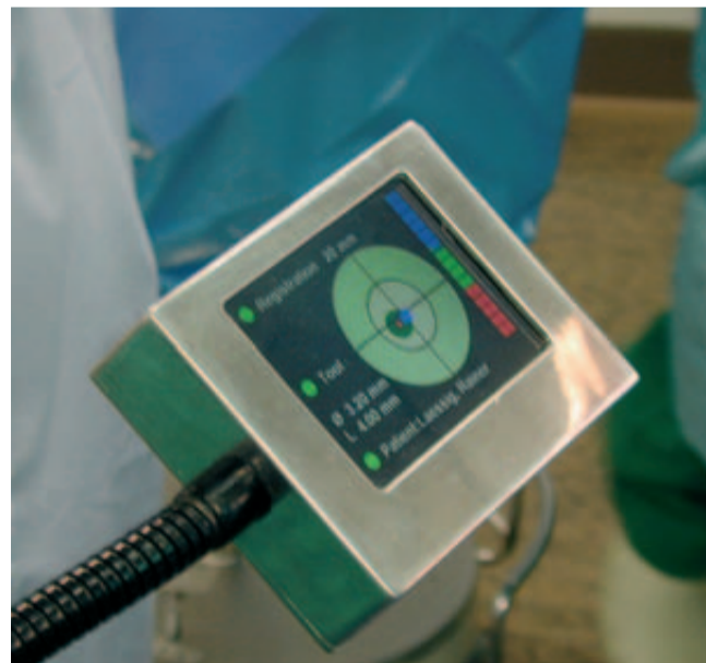
Abb. 2: Zielmonitor.

schlossenes und hochintegriertes Behandlungssystem. Während der eigentlichen Operation ist keinerlei Systembedienung erforderlich. Das Navigationssystem erkennt automatisch die Länge des eingespannten Bohrers und identifiziert selbstständig das gerade zu bohrende Implantat. Auch die Zuordnung zu den medizinischen Bilddaten und die für eine hohe Präzision erforderliche Kalibrierung des Systems, die sogenannte Registrierung, erfolgt vollkommen automatisch. Durch diese Automatik wird die Sicherheit und Genauigkeit des Systems deutlich erhöht, das Risiko der Fehlbedienung durch den Anwender wird minimiert.