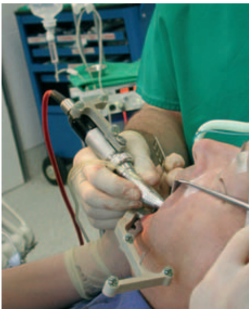
Abb. 1: Navigationshandstück.

In der Operation entfernten wir Step by Step die gelockerten Zähne, wobei exakt auf die Schonung der umliegenden Knochenstrukturen, vor allem der noch vorhandenen vestibulären Knochenlamellen im koronalen Bereich geachtet wurde. Die Entfernung erfolgte daher ausschließlich mit Mikroskalpell und Periotom, um die Desmodontalfasern bis zum Apex zu lösen. Die Alveolen wurden mithilfe von Küretten degranuliert und maschinell mit Rosenbohrern aufbereitet, um gleichzeitig