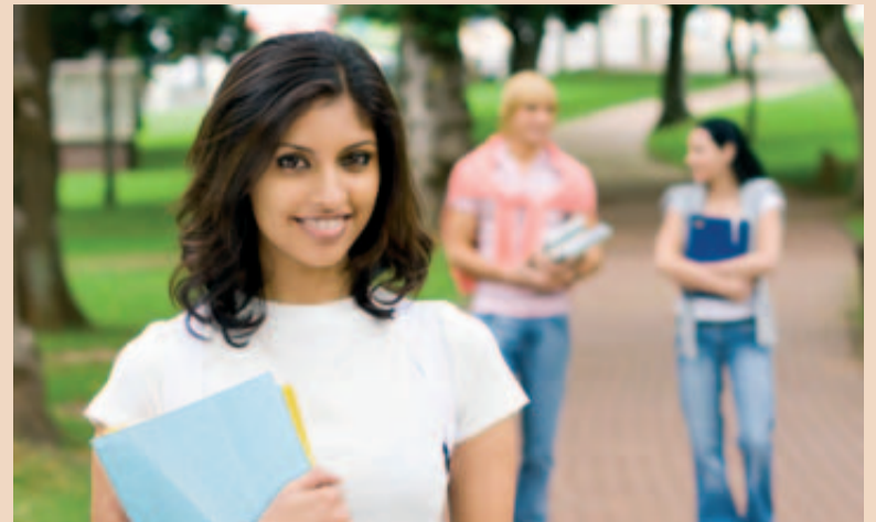
Für die Studenten in der Zahnmedizin sollen sich die Ausbildungsinhalte verbessern.

Der Präsident des nationalen Dentalrates betonte auch die Bedeutung für die Gesundheitspolitik des Landes. „Unsere Zahlen belegen, dass nur vier bis fünf Prozent der Bevölkerung einen