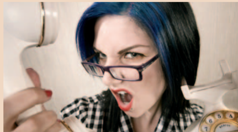
Ein Viertel der Patienten hält Abstand von ihrer geplanten Beschwerde über ihre zahnärztliche Behandlung.

Das zahnärztliche Finanzierungssystem ist in Großbritannien anders als in Deutschland aufgebaut. 80 Prozent der Zahnbehandlungskosten werden vom öffentlichen NHS getragen. Die Selbstbeteiligung entfällt für bestimmte Gruppen, etwa für Schwangere, Auszubildende bis 19 Jahre, Arbeitslose und sozial Schwache. Die private zahnärztliche Versorgung setzt dann ein, wenn der Patient eine höherwertige Versorgung verlangt, die nicht aus den Steuergeldern finanziert werden. [1]