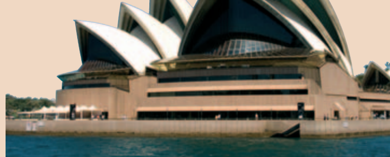
In Sydney treffen sich Kieferorthopäden aus aller Welt.

Schwerpunkte sind das wissenschaftliche Programm für das Gebiet KFO und Veranstaltungen für weitere Teammitglieder der kieferorthopädischen Praxis. Die