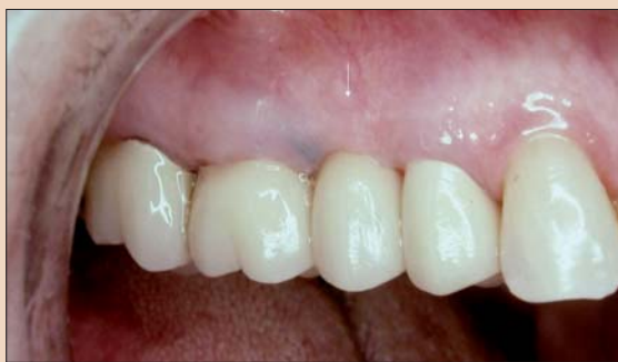
Рис. 14. Постоянный протез.

В данном случае пациентка долгие годы носила съемный протез, замещавший утраченный зуб. После хирургического вмешательства я уменьшил размер этого протеза, чтобы обеспечить достаточное пространство для заживления области трансплантации.