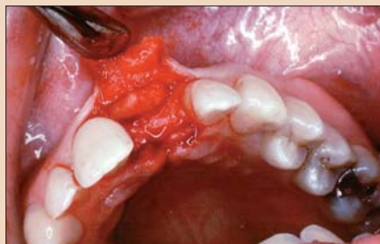
Рис. 7. Правильно размещенный трансплантат из соединительной ткани.