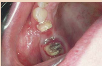
Рис. 11. Вид того же дефекта без временного протеза со стороны окклюзии.