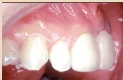
Рис. 9, б. Латеральный снимок после коррекции дефекта и заживления.