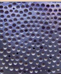
Увеличенное изображение комозитной металлической пены (ДП).

Он отметил, что благодаря этим характеристикам пены прочность и механическая стабильность имплантатов в костной ткани в будущем могут быть существенно улучшены.