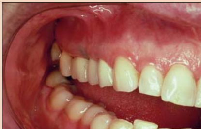
Рис. 13. Выполнено увеличение объема десневой ткани, установлен новый временный протез; обратите внимание на улучшение эстетики.