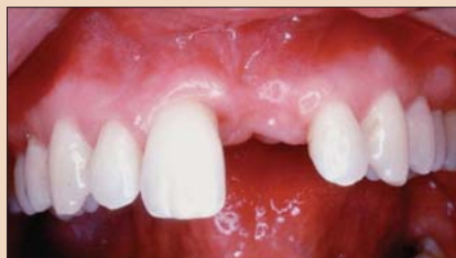
Рис. 2. Фронтальный снимок области утраченного зуба 9.