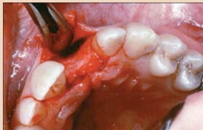
Рис. 6. Смещенный лоскут, обнажающий дефект костной ткани.