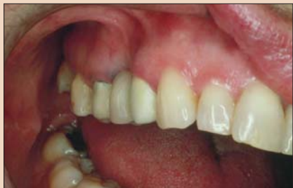
Рис. 12. Фронтально-щечный снимок того же дефекта.