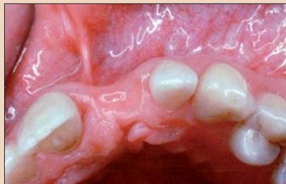
Рис. 4. Вид со стороны окклюзии, демонстрирующий тот же дефект.