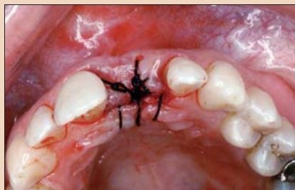
Рис. 8. Трансплантат пришит к лоскуту, лоскут репозиционирован и ушит для обеспечения стабильности.