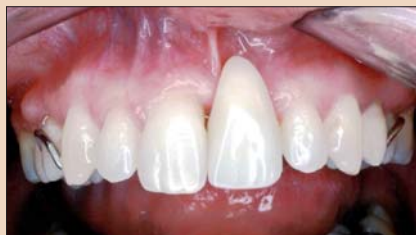
Рис. 1. Исходный фронтальный снимок области утраченного зуба 9 со съемным протезом.

После тщательной оценки под эпилител за одну хирургическую процедуру был подсажен аутогенный трансплантат из соединительной ткани. Под анестезией было выполнено выделение лоскута и его лабиальное смещение (рис. 5 и 6). Донорский участок для забора соединительной ткани, играющей роль трансплантата, можно выбрать в разных областях. В данном клиническом случае была выбрана область бутриности (tuberosity area). Донорская ткань была освобождена от эпителия, после чего деформированной области десны была придана необходимая форма. Форма лоскута была выбрана с таким расчетом, чтобы предотвратить рецессию в области соседних зубов и обеспечить закрытие трансплантата во избежание образования келоидной ткани, которая имела бы иной цвет и препятствовала бы достижению гармоничной цветовой интеграции тканей. Затем контур лоскута был продлен в направлении неба с тем, чтобы захватить больше прикрепленной десневой ткани, избежать образования келоида и зафиксировать трансплантат. После разращения донорской соединительной ткани в необходимом месте была проведена репозиция лоскута и его ушивание для обеспечения стабилизации трансплантата (рис. 7 и 8).