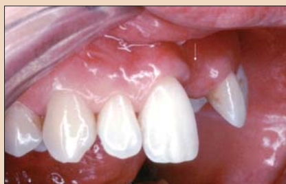
Рис. 9, а. Латеральный снимок: исходный вид дефекта.