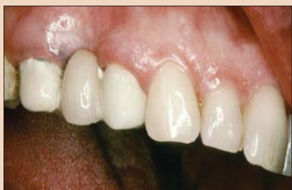
Рис. 10. Область жевательных зубов верхней челюсти со значительным дефектом десны, вид сбоку.