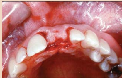
Рис. 5. Вид лоскута со стороны окклюзии.