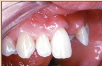
Рис. 3. Латеральный снимок, демонстрирующий дефект десны.