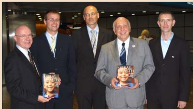
Presentazione del libro Oral Health Atlas.