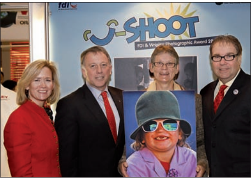
U-Shoot Avrupa Bölgesi kazananları ile FDI ve Wrigley delegeleri birarada.

Dubai'de düzenlenen 2007 FDI yıllık Dünya Dental Kongresi'nde FDI Dünya Dental Federasyonu Wm. Wrigley Jr firması ile 2008 FDI & Wrigley Fotoğraf ödülünü vermek üzere işbirliğine başladı.