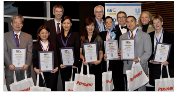
FDI ve Unilever delegeleri ile 2008 poster yarışmasında dereceye girenler bir arada.

uyku apnesinde ağız apareyi ile tedavi sonrası kognitif fonksiyonların geliştirilmesi'