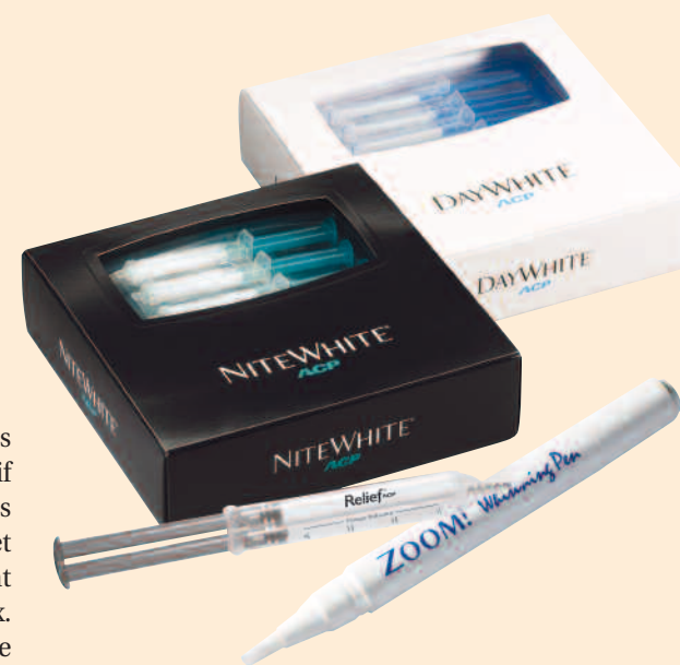
Gammes Day White et Nite White

Les produits d'éclaircissement Discus Dental sont les seuls à intégrer dans leur formulation de l'ACP, un actif breveté qui permet de diminuer significativement les éventuelles sensibilités liées ou non au traitement et de reminéraliser la surface de l'émail, en apportant lustre et brillance pour un résultat plus harmonieux. De nombreuses références sont disponibles afin de proposer un traitement sur mesure aux patients qui souhaitent éclaircir leur sourire.