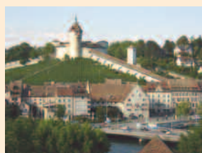
La ville de Schaffhouse