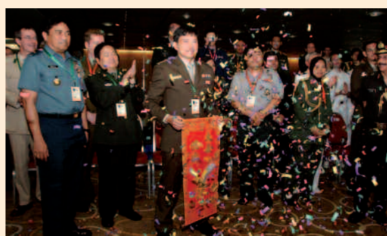
La cérémonie inaugurale du programme militaire 2009 à Singapour

Le 31 août dernier, le brigadier général (Dr) Benjamin Seet, chef du corps médical des Forces armées de Singapour, présidait la cérémonie inaugurale du programme militaire du congrès dentaire mondial annuel 2009 de la FDI. Dans son discours de bienvenue, il a souligné l'importance du thème de cette année : « Les soins dentaires pour la prochaine génération des Forces armées ». Les services de soins de nombreuses forces armées étant en cours de transformation pour répondre à une gamme plus vaste d'enjeux géopolitiques et militaires. Cette réunion donnait aux participants la pos-