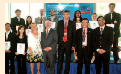
Des représentants de la FDI et d'Unilever avec les gagnants du Concours d'affiches 2009

Plus de 120 affiches sont parvenues à la FDI pour le concours de cette année. Les meilleures affiches ont été sélectionnées comme finalistes avant le