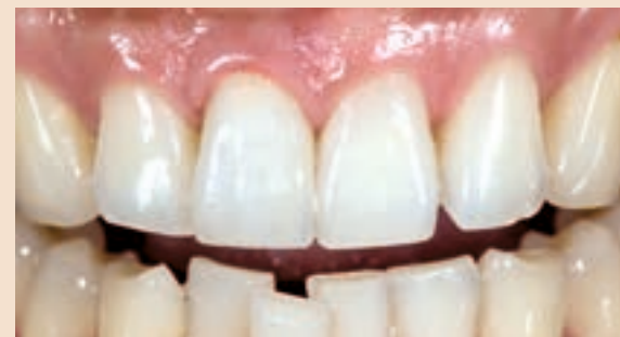
Sl. 20 Post-op slika centralnog sjekutića korištenjem VM 13 (Vident)

bojom. Ovo je za dentalnog tehničara koji će raditi keramički nadomjestak da vidi boju preparacije i da bude u mogućnosti modificirati boju nadogradnje ili bataljka prema potrebi, za kompenzaciju boje preparacije. Kritično je da sve snimke budu snimane s ključem boja i zubima koji se procjenjuju u jednakj vertikalnoj ravnini, budući da se predmeti bliži ravnini filma percipiraju kao svijetliji, a oni udaljeniji kao tamniji. Ključ boja i zubi trebali bi biti namočeni s glazirajućom tekućinom, kako je prethodno već opisano. Ove fotografske informacije služit će dentalnom tehničaru koji će raditi keramički nadomjestak za vizualiziranje kontrasta između ključa boja i prirodnih zuba.