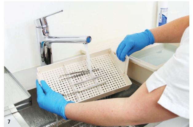
Abb. 5: Wanne zudecken und Einwirkzeit abwarten. – Abb. 6: Nach Ablauf der Einwirkzeit den Abtropfeinsatz herausnehmen. – Abb. 7: Instrumente gründlich mit Wasser abspülen.

Wasser abgespült bzw. mit einer Instrumentenbürste abgebürstet. Unter keinen Umständen eignen sich Drahtbürsten für diesen Schritt.