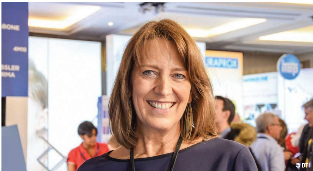
La dottoressa Michèle Reners, ex presidente di EuroPerio e presidente della Società belga di implantologia orale Michèle Reners, spiega la meccanica dello stress patologico come fattore aggravante della malattia parodontale.

Il modo in cui lo stress agisce sul sistema immunitario è riassunto secondo l'asse ipotalamo-ipofisi-surreneale. Lo stress psicosociale è in grado di attivare l'ipotalamo, che secreta l'ormone adrenocorticotropico, che a