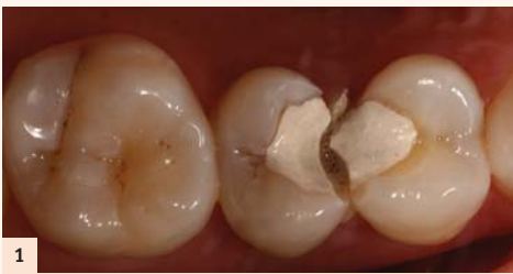
Fig. 1 : Echech de temporisation à l'IRM avec persistance de douleurs non spontanées exacerbées au froid.