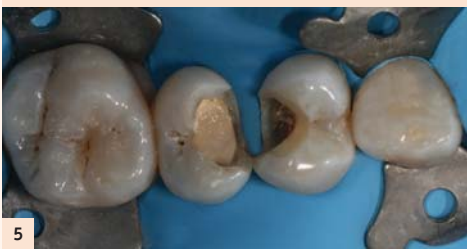
Fig. 5 : Du Biodentine est déposé sur l'effraction et légèrement « foulé ». Une attente de 8 à 10 min est nécessaire pour la prise complète du matériau. Les limites amélaire de la cavité sont préservées pour assurer une bonne étanchéité de la future restauration.