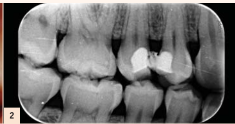
Fig. 2 : L'analyse radiologique nous montre une proximité pulpaire des restaurations provisoires, surtout au niveau de la 15.