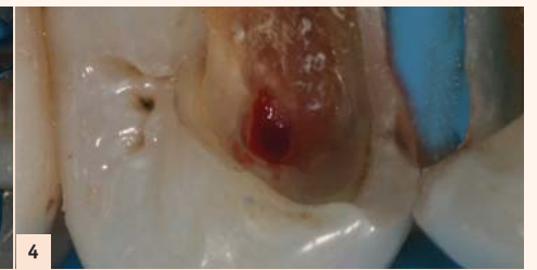
Fig. 4 : Le saignement pulpaire étant contrôlé, la cavité est désinfectée à l'aide d'une boulette de coton légèrement imprégnée d'hypochlorite.