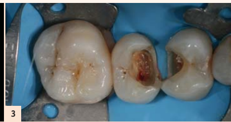
Fig. 3 : Après dépose des restaurations provisoires sous champ opératoire, une effraction pulpaire est mise en évidence.