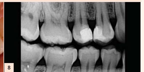
Fig. 8 : Une rétraction pulpaire avec la formation d'un pont dentinaire dû à la biocompatibilité du Biodentine est visible sur la 15 par comparaison avec la 14.