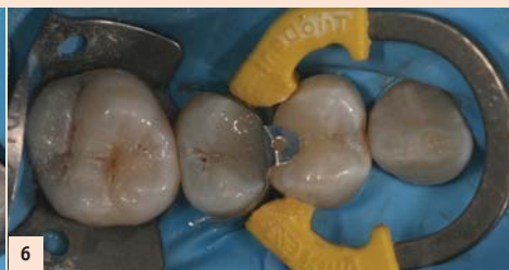
Fig. 6 : Un composite direct est réalisé sur la 14 puis sur la 15. Un protocole d'adhésion standard est effectué sur le Biodentine.