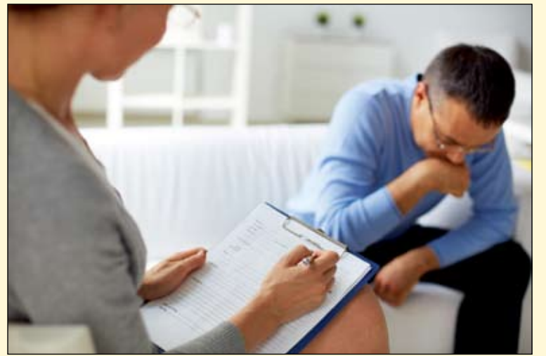
感知行为治疗师可以通过重建患者的思考和破坏消极的思考循环来帮助他们改变感觉和行为

“感知行为治疗降低了怀有恐惧的急治疗或需要进行极具侵入性的治疗的患者对镇静的需求，但仍有一些需要紧急治疗或需要进行极具侵入性的治疗的患者需要镇静。”牛顿说到。DT