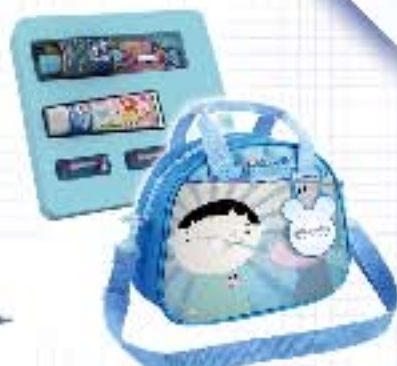
专业儿童护理计划