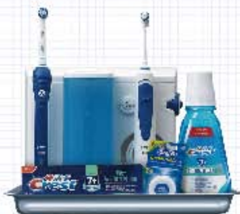
专业种植护理计划