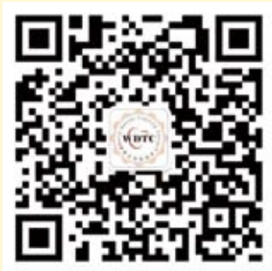
世界牙科论坛微信公众平台

《牙科世界》是国内第一款关于口腔医学信息的APP应用，专门为口腔专业人员提供行业最新资讯，学术文章，教育培训，病例讨论，最新产品，求职招聘等相关信息。