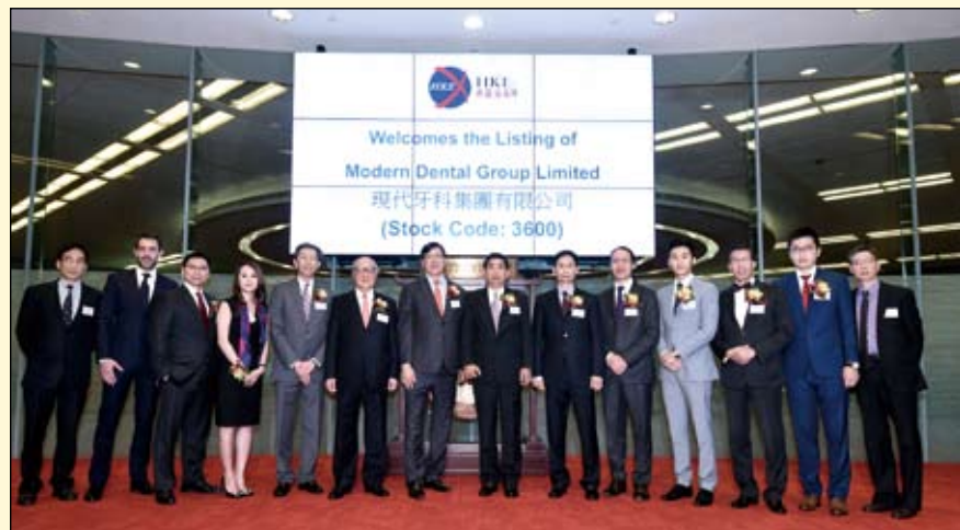
现代牙科集团在香港主板市场成功上市

为开拓中国内地市场，现代牙科集团于1998年投资成立了洋紫荆牙科器材(深圳)有限公司。2009年洋紫荆牙科器材(深圳)有限公司又投资成立了洋紫荆牙科器材(北京)有限公司，负责中国北方的市场。目前，洋紫荆已成为中国内地市场最大的义齿制作公司之一，在业界享有良好口碑，客户群遍及内地各大中城市，国内数十所知名大学