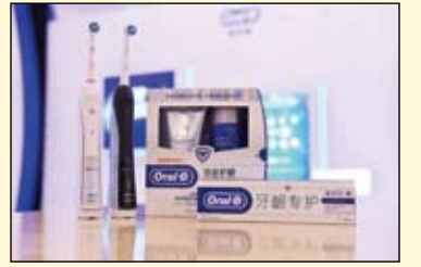
欧乐B洁齿护龈家用双管套装及牙龈专护系列

与欧乐B洁齿护龈家用双管套装同步上市的还有3款牙龈专护牙膏。通过全套护龈系列产品的推出，欧乐B将口腔专业护理成分与功效浓缩于家用，为万千中国消费者提供更全方位的家庭专业口腔护理体验。