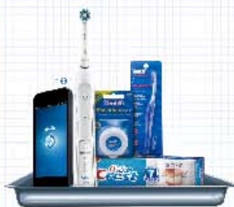
高端正畸护理计划