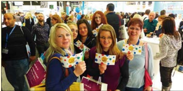
在2015年科隆国际牙科展 (IDS) 上, 世界牙科论坛 (DTI) 展示了全新设计的公司标识。

在刚刚过去的一年中, 世界牙科论坛 (DTI) 可谓是硕果累累。随着众多新的会展活动与牙科组织加入到世界牙科论坛 (DTI) 的合作伙伴关系, 公司旗下的出版物产品线也进一步得到扩充。在此, 世界牙科论坛 (DTI) 感谢全球读者与合作伙伴的大力支持。通过制定一系列新的项目与目标, 世界牙科论坛 (DTI) 期待在新的一年里取得更大成就。