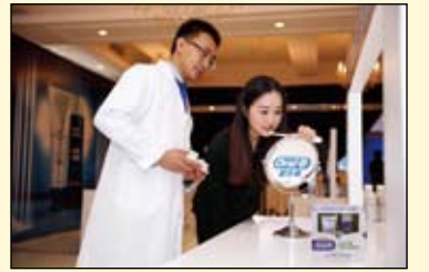
与会者现场体验欧乐B洁齿护龈家用双管套装

管套装，突破性地将深层清洁与后续修护的活性成分独立封存于两管中。使专业护龈成分可以释放更有效的活性因子，到达难刷部位，深层洁净；并能形成保护膜，实现1+1大于2的效果。