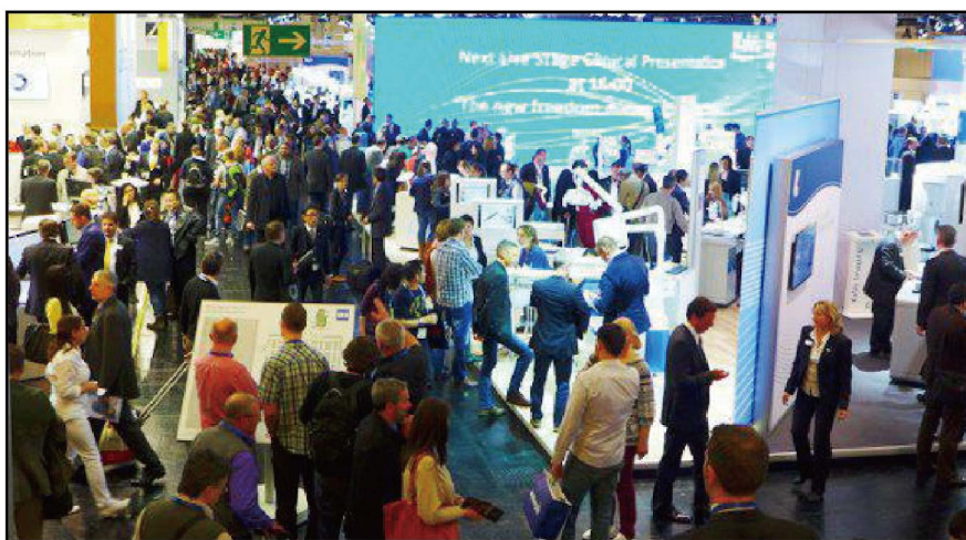
●预计将有超过2200名牙科工业代表参加2017年科隆国际牙科展(IDS 2017)

在2017年的科隆国际牙科展(IDS)期间,世界牙科论坛(DTI)将继续向全球读者提供来自展会的时讯。除了《今日》展会特刊(Today)以外,世界牙科论坛(DTI)还会向全球订阅用户提供电子通讯服务。有意通过世界牙科论坛(DTI)媒体产品宣传2017年科隆展产品的参展商可参阅世界牙科论坛(DTI)在2017年科隆展(IDS 2017)上的出版产品名册(DTI Media Kit),或直接咨询世界牙科论坛(DTI)销售团队。