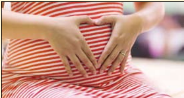
台湾有关方面放宽妇女孕期免费洗牙的举措旨在保障孕妇的口腔健康与胎儿的正常发育。

近日, 台湾“中央健康保险署”(健保署)决定将孕期妇女可享受的免费洗牙服务次数从原来的一次增加到三次。由于荷尔蒙和饮食习惯的改变, 处于怀孕期的妇女更容易发生龋