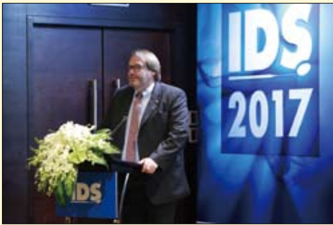
马库斯·海巴赫博士对欧洲牙科市场做详细分析。