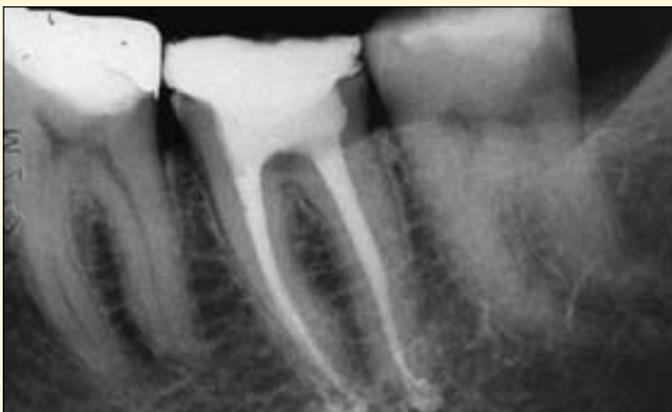
图7: 治疗结束后的X线片。