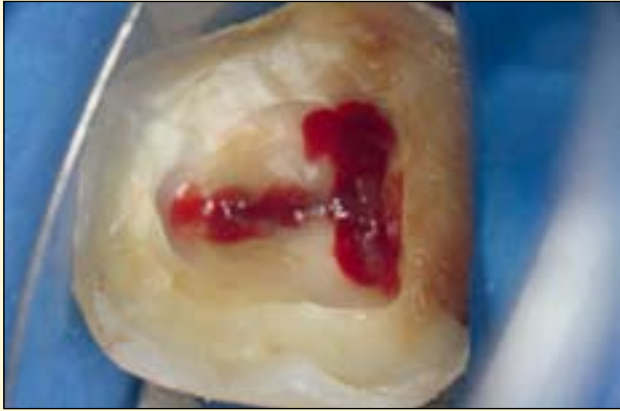
图4: 建立髓室通路并定位根管口。