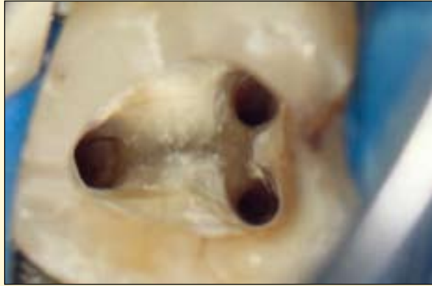
图5: 根管成形和消毒。