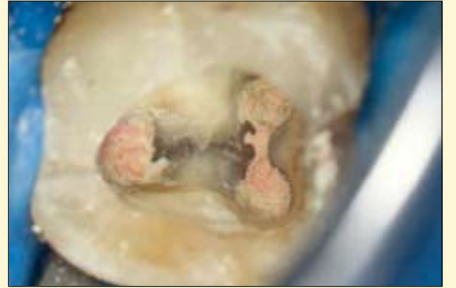
图6: 用牙胶和MTA-FILLAPEX充填后的根管。