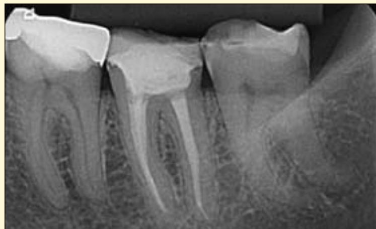
图8: 17个月后随访时的X线片。

30号挫,而在远中根管预备中,我们用了#40号挫。用这种方法,顺序进行根管的预备、成形和冲洗,近中根管用RECIPROC 40工具进行预备,远中根管