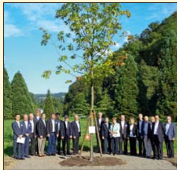
全球子公司的总经理一同种下美洲红橡树来纪念Peter Geistlich。

许多人都对Peter Geistlich有独特的回忆，盖氏制药各国子公司的总经理也都想表达他们对Peter Geistlich的敬意。没有什么能比得上在沃卢森(Wolhusen)一起为他种树更有纪念意义的了。几年之后，那颗红橡树苗将成长为一棵参天大树，在沃卢森(Wolhusen)的深秋焕发出智慧的光芒。