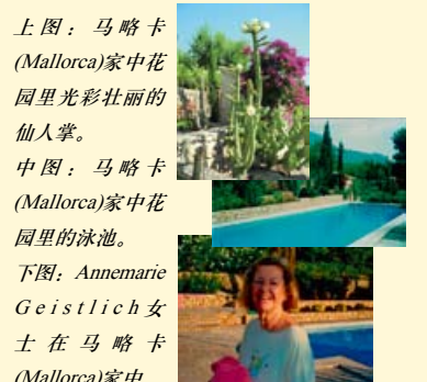
上图：马略卡 (Mallorca) 家中花园里光彩壮丽的仙人掌。 中图：马略卡 (Mallorca) 家中花园里的泳池。 下图：Annemarie Geistlich女士在马略卡 (Mallorca) 家中。