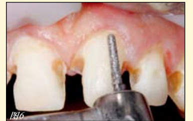
图1: 初始状态: 多处龋损、变色的复合树脂修复体和磨损区域, 影响笑容。图2: 硅胶导板在石膏模型上就位, 制作新笑容的诊断蜡型。图3: 用Tetric N shade guide比色板比色; 用OptraGate牵拉唇颊。图4: 双侧中切牙远中面用金刚砂轮预备。图5: 为侧切牙获得空间来改善牙齿比例。图6: 用球形末端的锥形金刚砂车针来进行微创贴面预备。