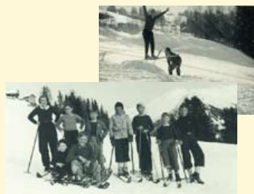
上图：偶尔去跳跃释放自己的激情吧，勇敢的滑雪者！ 下图：与家人和朋友一起滑雪是他人生最快乐的事情之一。

在拉蒂高 (Prättigau) 的席尔斯读寄宿学校的这些年，让他终生心系 Klosters-Davos 的滑雪区。