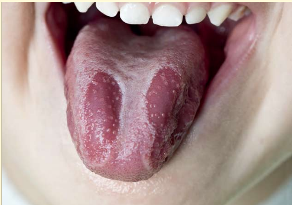
良性游走性舌炎困扰着全球2%的人群。