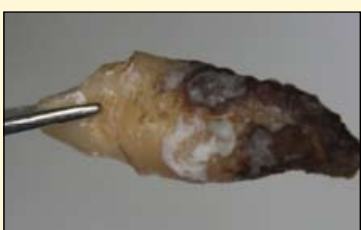
图3: 顽固的牙结石沉积。

如果牙周炎中出现龈下感染，仅龈上牙齿的清洁并不能清除感染，也不能清除掉龈下菌膜和结石。此时要通过仪器进行牙齿表面的龈下治疗。这项工作有时很难完成，因为有的顽固结石牢牢粘附在牙根表面(见图3)。