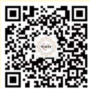
世界牙科论坛微信公众平台

《牙科世界》是国内第一款关于口腔医学信息的APP应用, 专门为口腔专业人员提供行业最新资讯, 学术文章, 教育培训, 病例讨论, 最新产品, 求职招聘等相关信息。