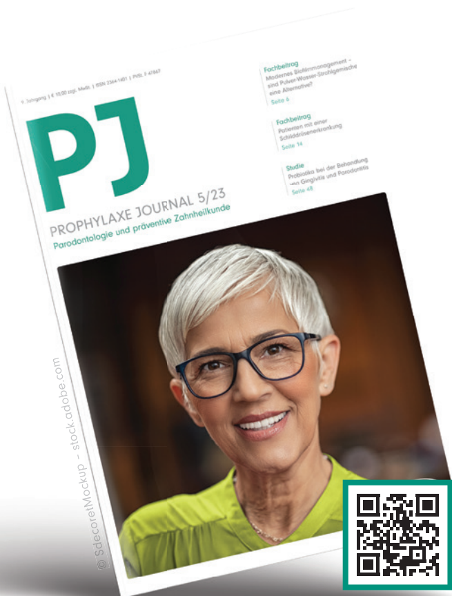
PJ 5/23 E-Paper lesen

Das aktuelle Prophylaxe Journal – Ausgabe 5/23 – wird sich erneut intensiv mit verschiedenen interessanten Aspekten der Zahn- und Mundraumgesundheit beschäftigen, beginnend mit der Bedeutung des „WIR“ in Bezug auf die Zusammenarbeit der verschiedenen zahnmedizinischen Vereinigungen und Gesellschaften wie auch in der Praxis, wo Teamarbeit und Patientenbeziehung im Mittelpunkt stehen.