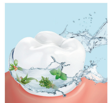
Mundspülung mit antibakterieller Wirkung