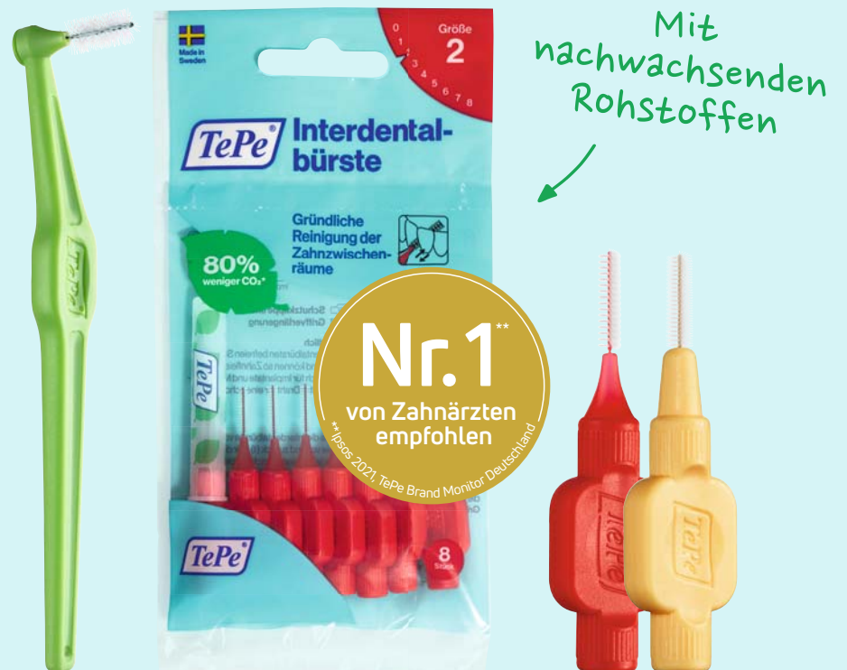
TePe Interdentalbürsten sind in verschiedenen Größen, Borstenstärken und Griffängen erhältlich. The right pick for your mouth.