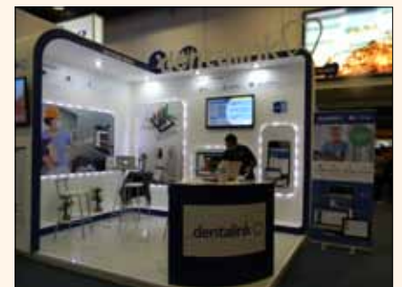
El stand de dentalink.