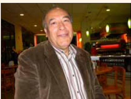
El nuevo director de AMOCOAC en la feria.