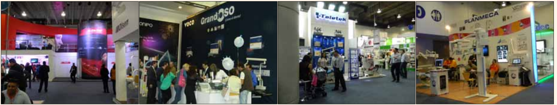
Vista de los stands de Ah Kim Pech, VOCO, Toletek y Planmecca.