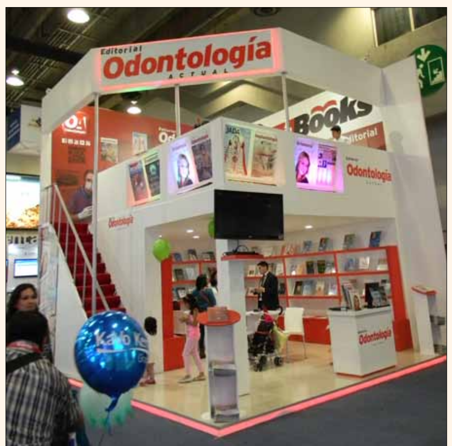
El stand de dos pisos de Odontología Actual.