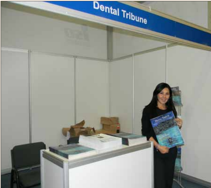
El stand de Dental Tribune al comienzo de la expo.