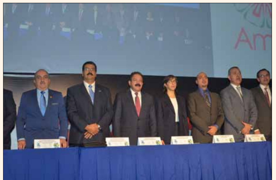
Los máximos directivos de la odontología mexicana durante la inauguración del Congreso Internacional de ADM, que ofrece de 52 conferencias en siete auditorios simultáneos.