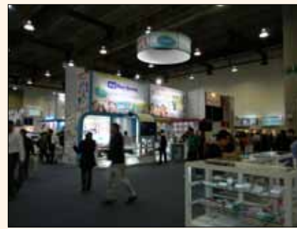
Vista de la feria comercial.