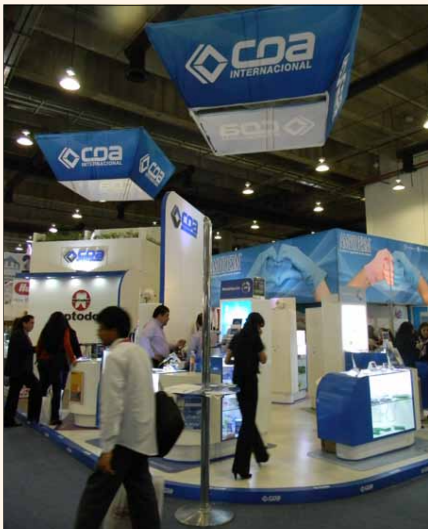
COA Internacional distribuye productos como los anestésicos de Septodont.