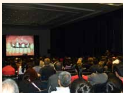
Uno de los cursos durante el congreso internacional de ADM.