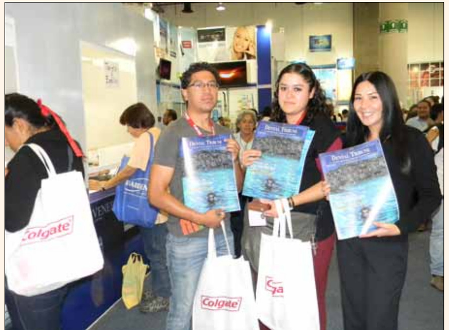
Varios asistentes con los ejemplares de Dental Tribune Latinoamérica.