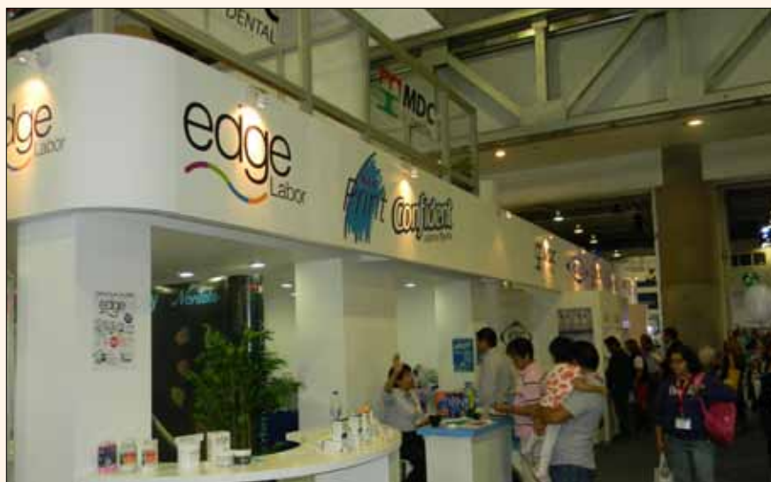
El stand de MDC en la feria de México.