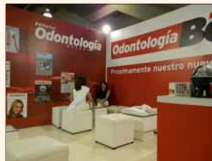
La parte superior del stand de Odontología Actual.